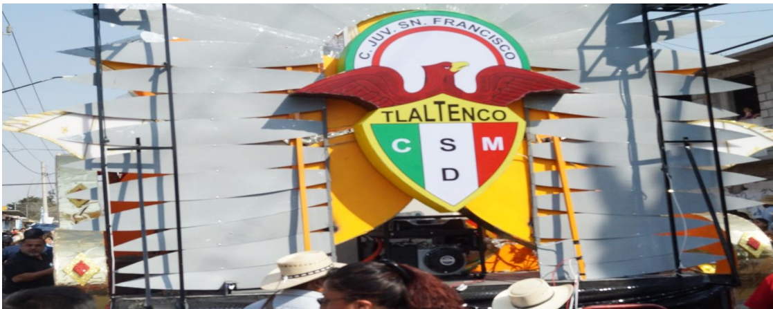
Foto: Gerardo Velarde Romero, 2018. Logo del carnaval de la comparsa Club Juvenil San Francisco Tlaltenco.

Por su parte la comparsa Club Juvenil de San Francisco Tlaltenco surge en el año de 1946, fue fundada e iniciada por personas que, con anterioridad pertenecieron a Sociedad Benito Juárez. Estas son las comparsas de mayor renombre dentro del pueblo y de las cuales existen una mayoría de seguidores.