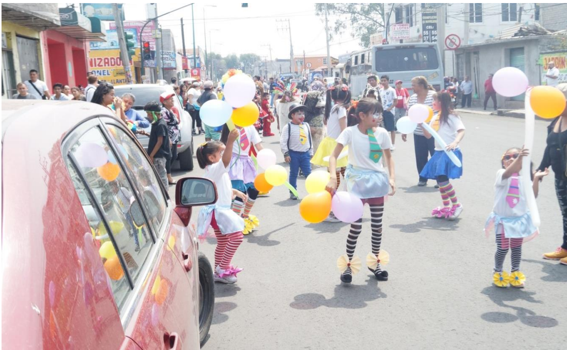
Foto: Gerardo Velarde Romero, 2018. Carnaval de disfrazados de la comparsa Zacateco.

Los conflictos antes señalados también tenían que ver con las calles y avenidas que se utilizan para los desfiles del carnaval, ya que como principales vialidades que se utilizan son las calles del centro del pueblo, tales como la calle Hidalgo, calle Independencia y la calle Morelos. Como avenidas que se ocupan para el carnaval, se utilizan las que llevan por nombre; San Francisco, San Rafael Atlixco y la avenida Tláhuac.