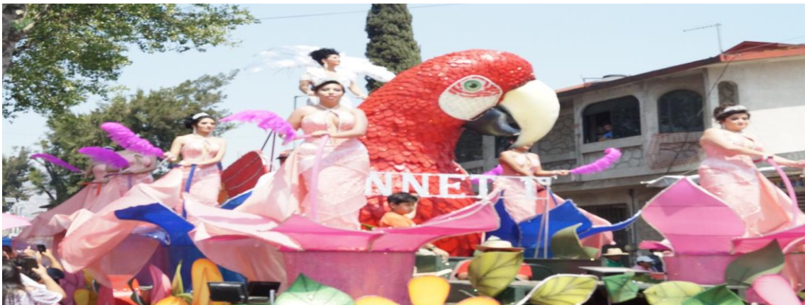
Foto: Gerardo Velarde Romero, 2018. Carro alegórico de la comparsa Sociedad Benito Juárez.

El primer grupo o comparsa que surgió fue la de la Sociedad Benito Juárez en 1920, posteriormente, con el paso del tiempo fueron surgiendo más comparsas en el pueblo, hasta que hoy en la actualidad, se sabe que son más de 10 grupos en todo el pueblo.