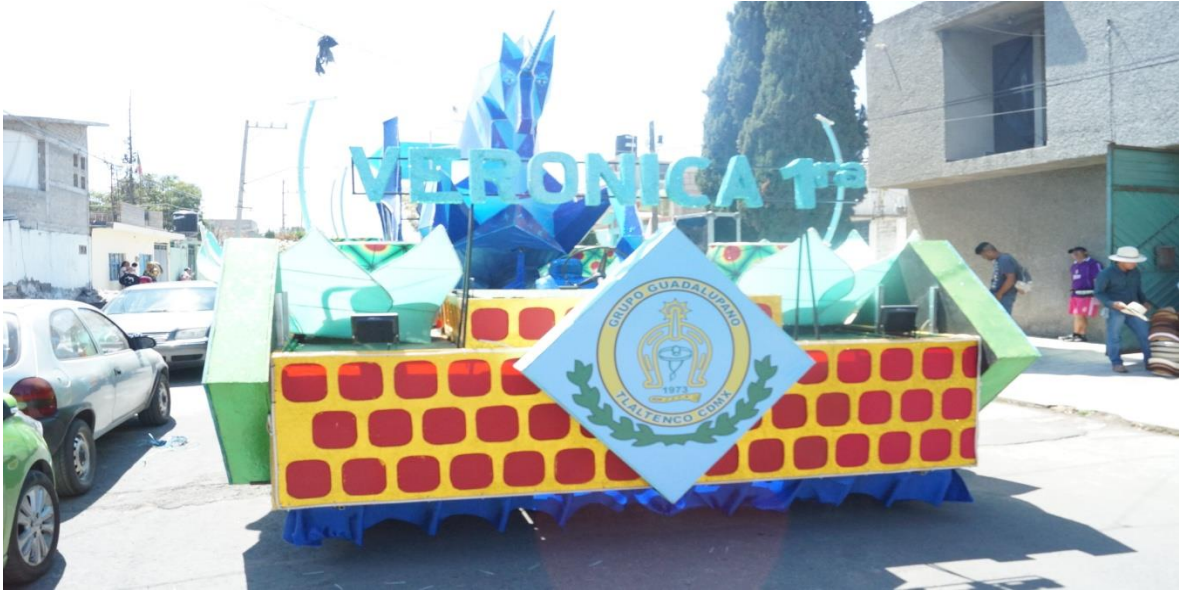
Foto: Gerardo Velarde Romero, 2018. Carro alegórico del carnaval de la comparsa Grupo Guadalupano.

Por otra parte, al hablar de las culturas populares y de lo popular, es preciso hablar también del territorio o el espacio que comprende el pueblo en sí, en este caso, el lugar en el que se realiza dicha celebración, Ezequiel Ander-Egg (2007) en torno a la comunidad de un pueblo refiere que: