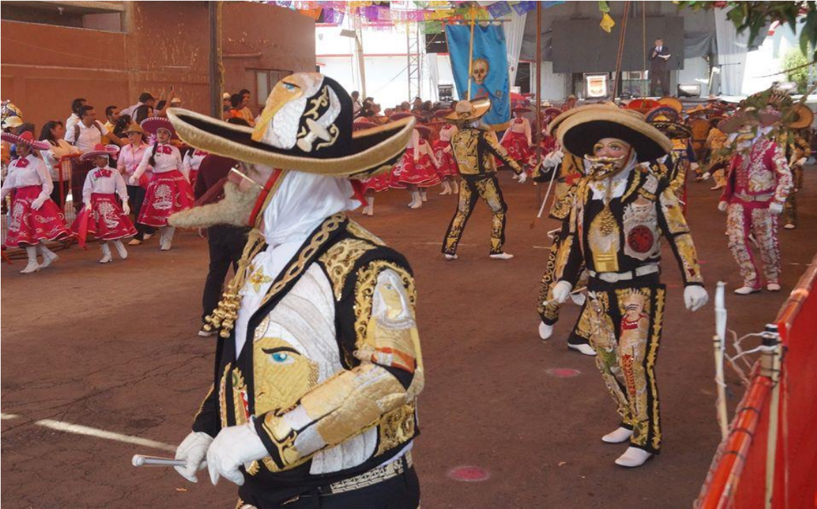
Foto: Gerardo Velarde Romero, 2018. Charros y damas de la comparsa Barrio Fuerte.