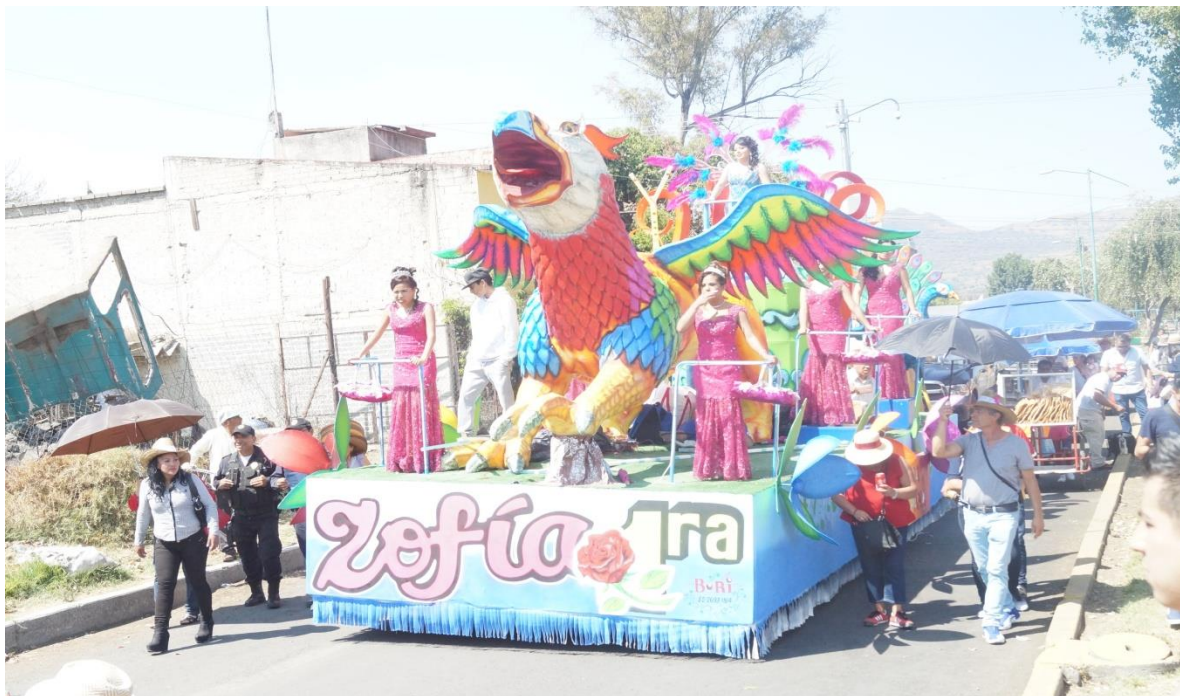
Foto: Gerardo Velarde Romero, 2018. Carro alegórico del carnaval de la comparsa Guadalupana.

Es así que las distintas comparsas configuran con sus similitudes y diferencias el carnaval del pueblo de San Francisco Tlaltenco y el conjunto de los carnavales de la zona dan cuerpo a la cultura de los pueblos originarios del sur-oriente de la Ciudad de México.