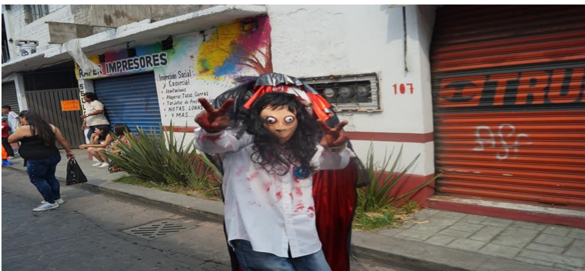
Foto: Gerardo Velarde Romero, 2019. Carnaval de la comparsa Chupamaros.

Estas aproximaciones que brevemente expuse, refieren en primer momento al sentido común en torno a la forma de pensamiento de las personas, después a aquellas formas de representación que acompañan al individuo en su entorno social y también a ciertos objetos o herramientas que sirven de guía en el actuar del individuo, de acuerdo a una serie de transformaciones en su entorno social.