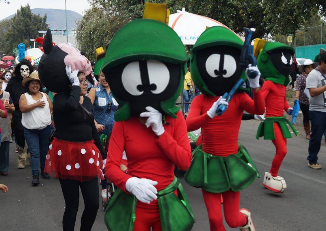
Foto: Gerardo Velarde Romero, 2017. Carnaval de disfrazados en San Francisco Tlaltenco, comparsa Club Juvenil San Francisco Tlaltenco.