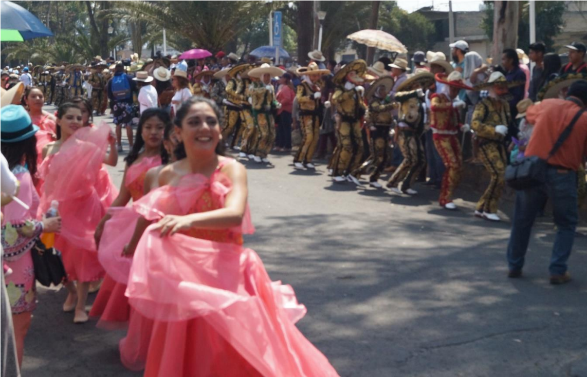
Foto: Gerardo Velarde Romero, 2018. Carnaval de gala. Vestuario de la comparsa Sociedad Benito Juárez.

Eso es en cuanto a los disfraces que las personas utilizan en el carnaval y como decía en párrafos anteriores, todo elemento que se muestra en el carnaval comunica, esta forma de comunicación abarca a lo que cada persona perteneciente al carnaval quiera invertir para su vestuario.