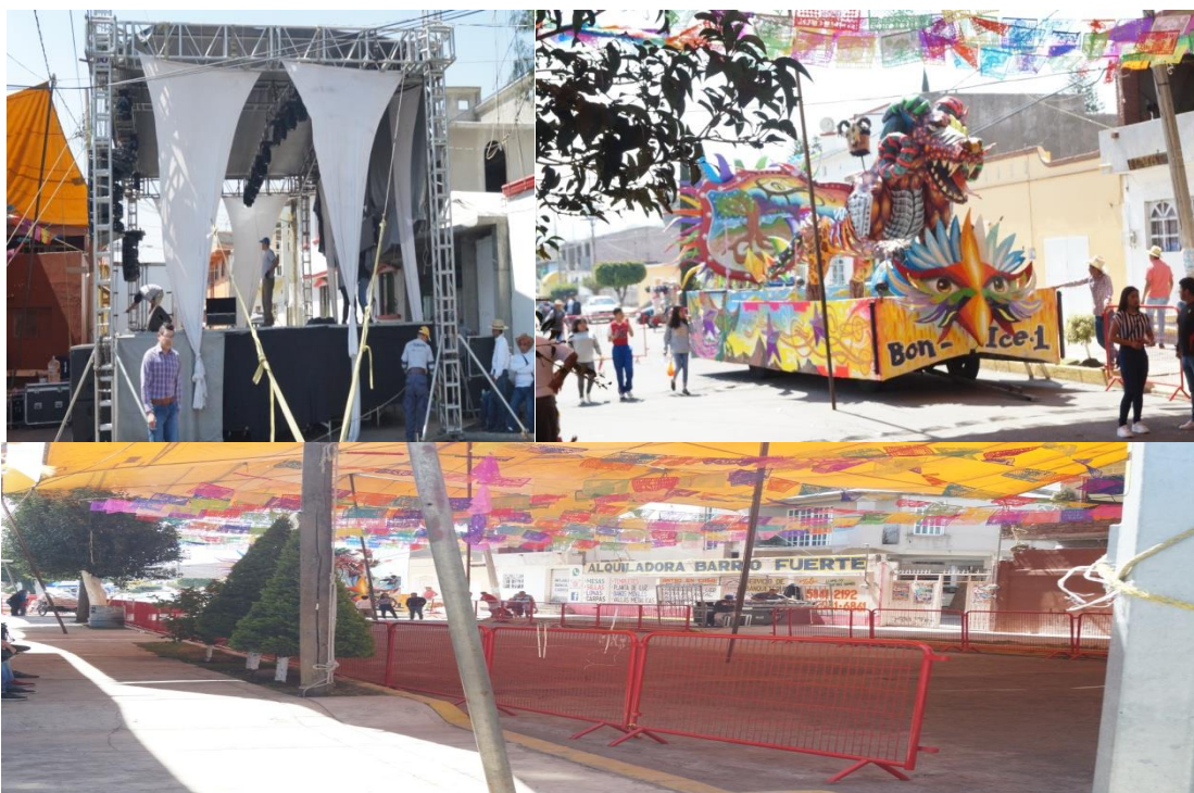
Fotos: Gerardo Velarde Romero, 2018. La previa para que salga el carnaval de Barrio Fuerte.

Los costos varían de acuerdo a los adornos que tenga cada traje y regularmente rondan de 13 a 18 mil pesos aproximadamente, aunque hay trajes que llegan a tener un costo de entre 20 a 60 mil pesos, dependiendo de los recursos económicos con lo que cuente la persona, es como elegirá su traje para participar en el carnaval, si bien es cierto que, aunque una persona quiera comprar un traje económico, aun así, le cuesta algo caro, razón por la que algunas personas prefieren alquilarlos.