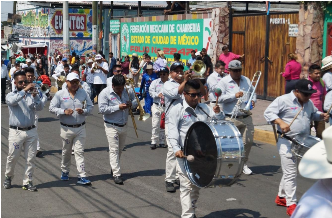
Foto: Gerardo Velarde Romero, 2018. Banda de música acompañando a la comparsa Club Juvenil San Francisco Tlaltenco.

Por lo anterior, es precisamente que en la práctica de las relaciones sociales donde la interacción comunicativa se desarrolla plenamente, y gracias a estas interacciones los habitantes de San Francisco Tlaltenco mantienen vivas sus prácticas culturales, mismas que forman parte de la riqueza cultural de este pueblo.