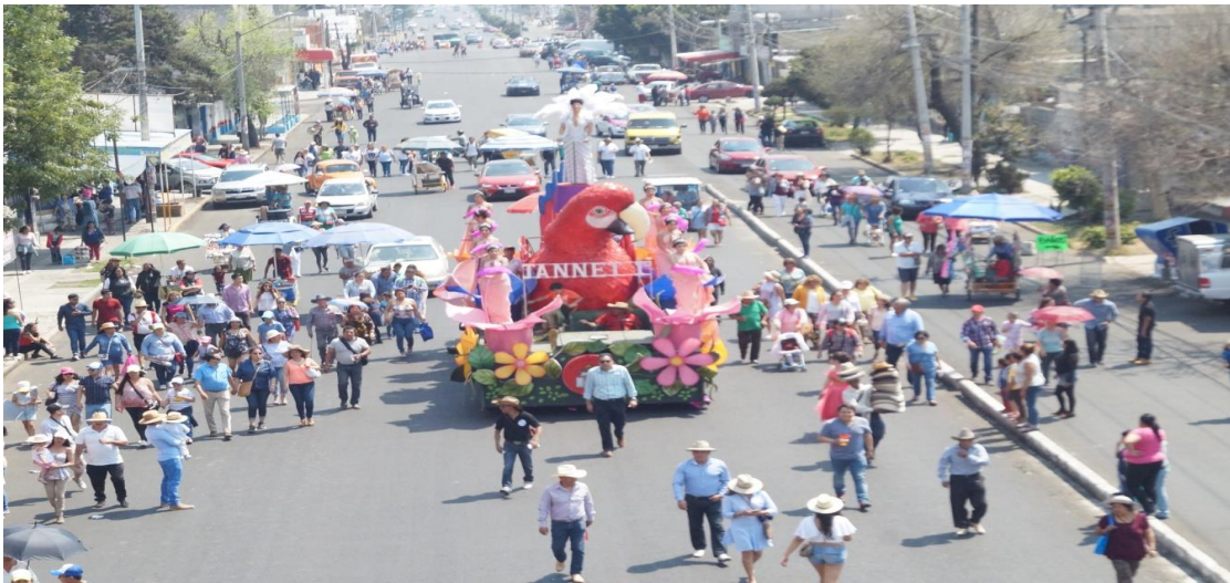
Foto: Gerardo Velarde Romero, 2018. Carnaval de la comparsa Sociedad Benito Juárez.

Ahora bien, desde la perspectiva de Carles Feixa (1998) en su libro El reloj de arena. Culturas juveniles en México . El autor plantea al concepto de juventud desde las sociedades primitivas hasta la sociedad post-industrial. Posteriormente, expone ejemplos y los describe sobre los diferentes sectores y bandas juveniles con sus culturas y particularidades.