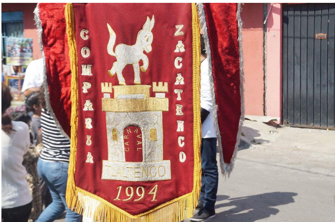
Estandarte de la comparsa Zacatenco.

Dicho lo anterior, comenzaremos por definir la primera categoría.