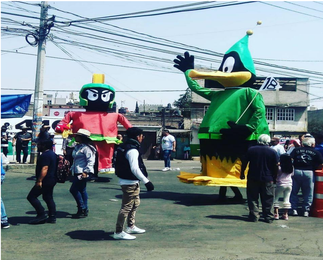
Foto: Gerardo Velarde Romero, 2020. Carnaval de disfrizados en San Francisco Tlaltenco, comparsa Club Juvenil San Francisco Tlaltenco.

La intencionalidad de este documental es crear un sentido de pertenencia de sus habitantes, ya que hoy en día la necesidad económica y de progreso los ha obligado a buscar alternativas laborales fuera de su comunidad.