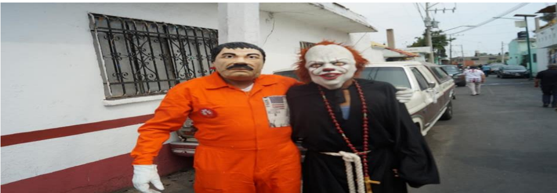
Foto: Gerardo Velarde Romero, 2019. Carnaval de disfrazados en San Francisco Tlaltenco, comparsa Chupamaros.

He de decir que de este libro me interesó de manera general el último apartado que mencioné, específicamente el carnaval de Tlaltenco que se lleva a cabo en la alcaldía Tláhuac, puesto que mi tema es sobre la identidad de las culturas populares de los habitantes de este lugar, para así relacionarlo con este carnaval.