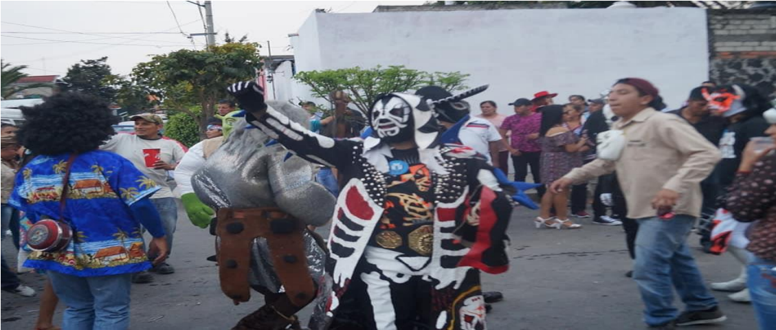
Foto: Gerardo Velarde Romero, 2019. Carnaval de gala, carnaval de disfrazados de la comparsa Chupamaros.