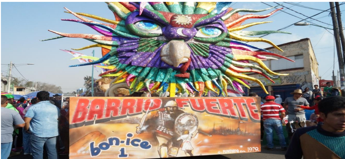
Carro alegórico de la comparsa Barrio Fuerte.