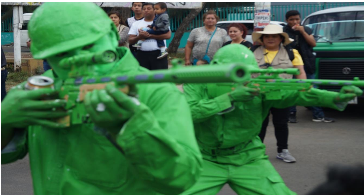
Foto: Gerardo Velarde Romero, 2017. Carnaval de disfrazados de las comparsas el Club Juvenil San Francisco Tlaltenco.

Estos sistemas de representación que señala el autor, se pueden ver en el carnaval de Tlaltenco, ya que es una fiesta que tuvo su origen como una mofa hacia los invasores extranjeros (españoles y franceses). De esta idea se partió para que surgiera este carnaval. Conforme pasó el tiempo, cambiaron dichas prácticas, si bien esta festividad surgió como una forma de protesta política, en la actualidad el carnaval se realiza con el afán de divertirse, aunque con esto no quiero decir que ya no hay una forma de protesta en el carnaval, sino todo lo contrario, ya que en los disfraces de las personas siguen apareciendo elementos que tienen que ver con una carga política, ejemplo de ello es que en el carnaval de Tlaltenco hay personas que se visten con máscaras y trajes de los actuales políticos, tanto nacionales como extranjeros. Esto ha hecho que la fiesta se siga preservando y para esto la gente participante tuvo que reinventarse.