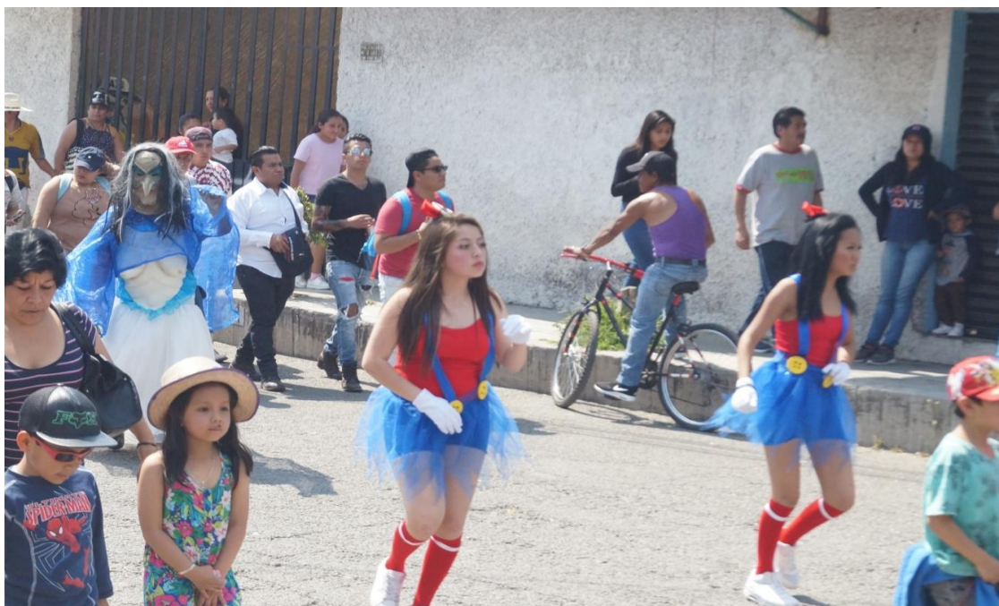
Foto: Gerardo Velarde Romero, 2018. Mujeres bailando en el carnaval de disfrizados de la comparsa Zacatenco.

Este dato tal vez parezca un poco irrelevante, pero es algo que consideré importante preguntar, ya que de esto se partió al principio, me refiero a lo que mencionaba de la identificación con el otro, ya que para el Tlaltenquense que disfruta del carnaval, le es significativo formar parte de un grupo social determinado, es ahí de donde parte para disfrutar esta fiesta que se realiza en el pueblo, fiesta que lleva poco más de 100 años de historia y que en la época actual sigue perdurando.