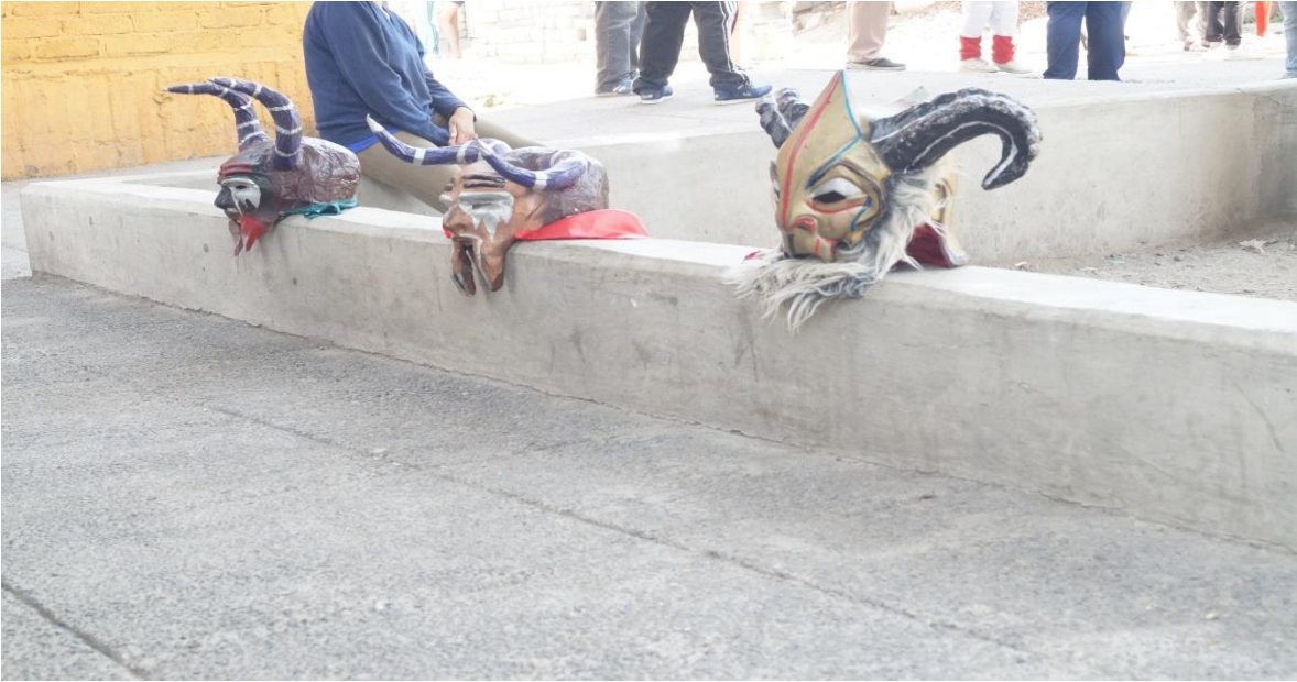
Foto: Gerardo Velarde Romero, 2018. Máscaras para el carnaval de la comparsa Zacatenco.

No obstante, lo popular también se difumina, se diluye y en ocasiones desaparece, ya que “ningún objeto tiene garantizado eternamente su carácter popular porque haya sido producido por él o éste lo consuma con avidez; el sentido y el valor populares se van conquistando en las relaciones sociales”. (García Canclini. 2002:215)