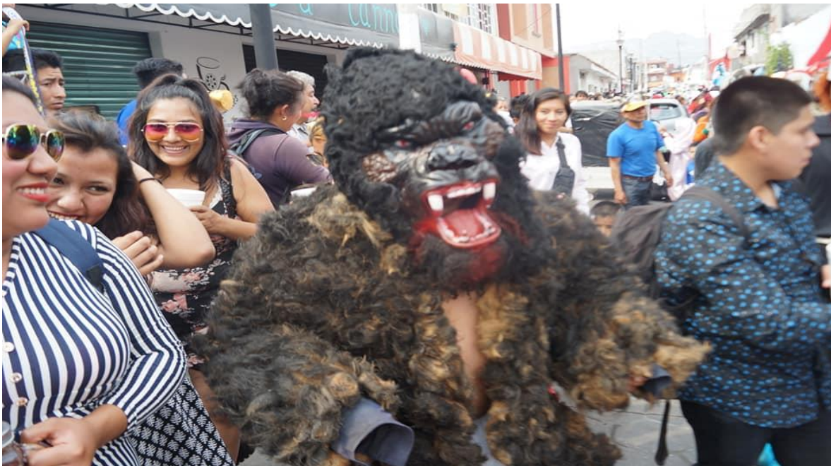
Foto: Gerardo Velarde Romero, 2019. Carnaval de disfrazados de la comparsa Chupamaros.

Para empezar, es lo máximo para nosotros, como brincadores, como directivos, como lo que se llame; es lo más grande para nosotros y es una forma de expresarnos, porque todos lo esperamos con entusiasmo, con esa alegría, con ese afán de salir a brincar un día, pero divertirnos lo mejor que se pueda, hasta llegar lo más cansados que se pueda. (Señor Rangel: 2018)