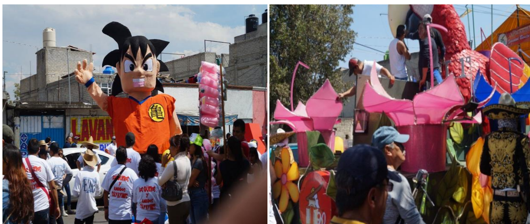
Carnaval de disfrazados de las comparsas el Club Juvenil San Francisco Tlaltenco (imagen de Gokú) y de la comparsa Sociedad Benito Juárez (imagen de carro alegórico).

Este complejo de acciones, se pueden apreciar en el pueblo de San Francisco Tlaltenco, específicamente con su carnaval, mismas que se emplean para los preparativos de esta celebración, una fiesta que sin duda requiere de mucho tiempo de las personas que lo realizan y de su preparación, ya que en el carnaval se requieren muchas personas, las cuales se ocupan de los aspectos organizativos para que salgan a bailar en las diversas comparsas que existen.