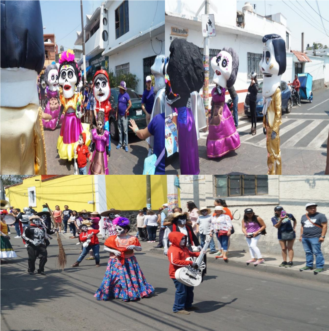
Fotos: Gerardo Velarde Romero, 2018. Temática de la película Coco en la comparsa Club Juvenil San Francisco Tlaltenco.

De este modo, la comunicación es fundamental en las relaciones interpersonales, ya que establece un medio necesario para entrar en contacto con las demás personas, conocer sus ideas y captar sus intereses, preocupaciones y sentimientos.