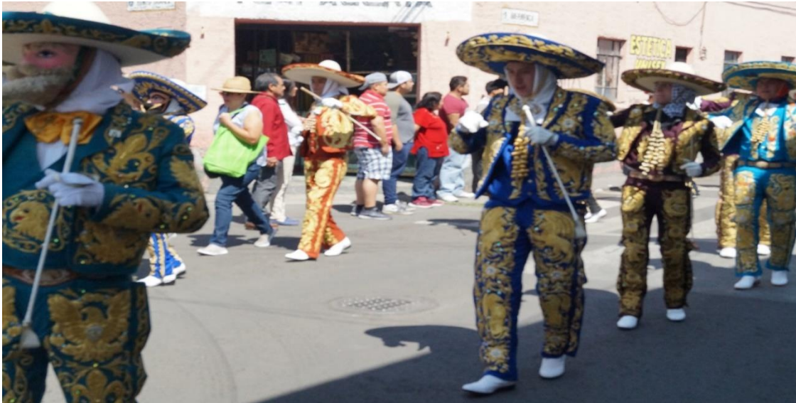
Foto: Gerardo Velarde Romero, 2018. Charros de la comparsa Sociedad Benito Juárez.

De esta manera, la gran mayoría de sus habitantes se sienten muy orgullosos de pertenecer a este lugar, llamándolo un pueblo hermoso, lleno de muchas tradiciones, tradiciones que siguen vivas hoy en día.