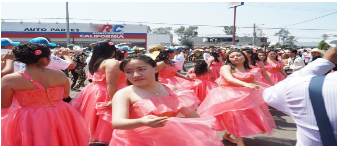
Foto: Gerardo Velarde Romero, 2018. Carnaval de gala, Damas de la comparsa Sociedad Benito Juárez.

Un ejemplo de ello es lo que me mencionó el primer informante en la entrevista a profundidad. Él me dijo que “la fiesta original nació en los años 20, al final de la revolución mexicana y entonces se crea para ayudarse entre la gente de aquí, en los años 50 esto se divide y empieza una competencia que gracias a Dios y por fortuna ahorita ya no hay tanta rivalidad, en el sentido agresivo, ya es como otra parte, competir en la parte del colorido” (Señor Marco: 2017).