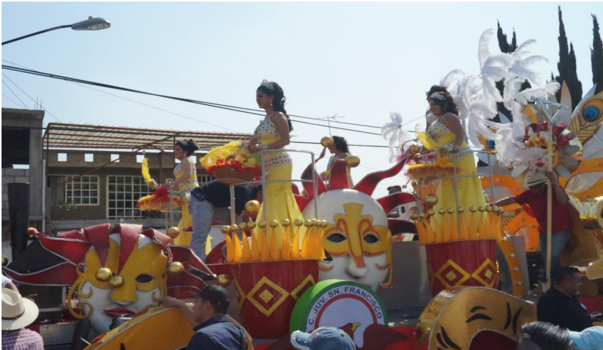
2018. Carnaval de la comparsa Club Juvenil San Francisco Tlaltenco.

La identidad es algo que nos diferencia o nos une con otras personas y va ligada con la cultura; y en el caso de los habitantes del pueblo de San Francisco Tlaltenco, el carnaval es algo que los identifica y a la vez, lo que los une como pueblo. Aunque también, es unión, entre las personas que lo realizan y los que asisten a esa celebración de armonía.