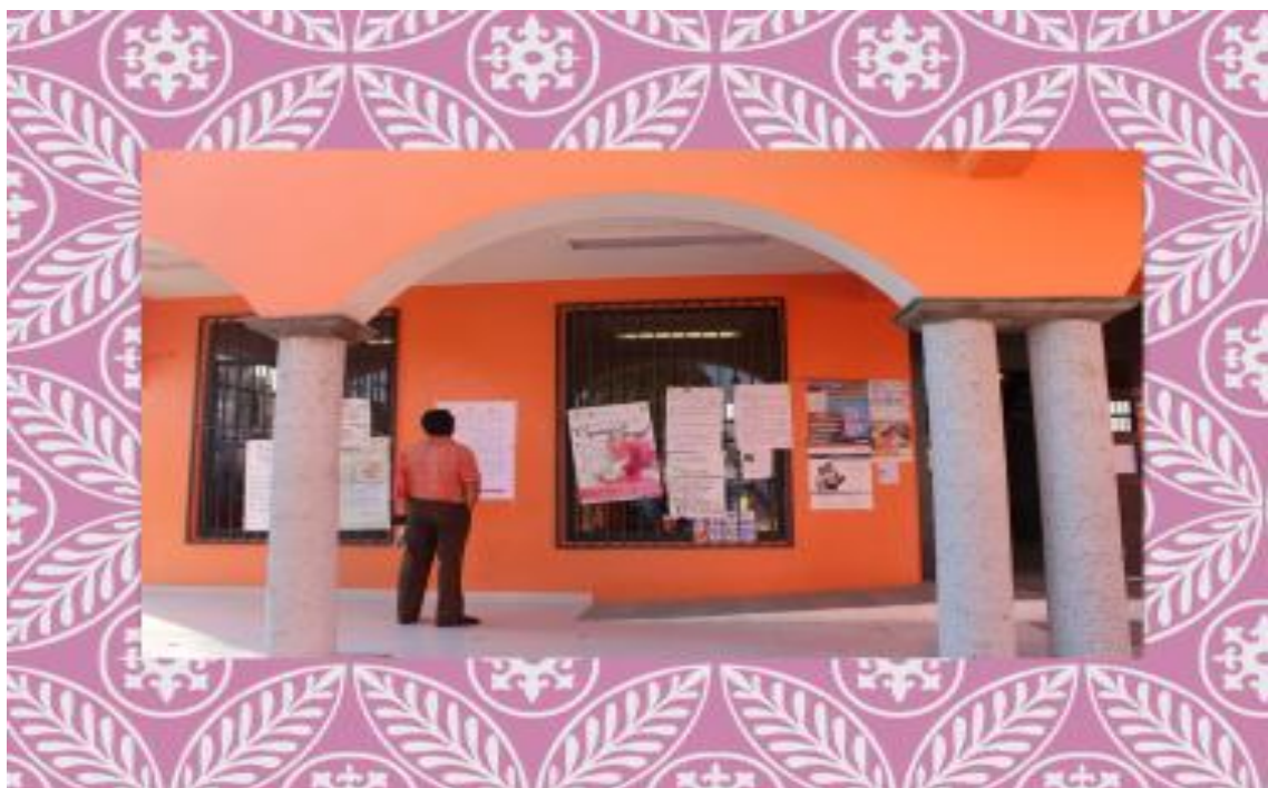
FOTO 6. Anuncios públicos de eventos políticos, culturales, sociales en la oficina de la coordinación.