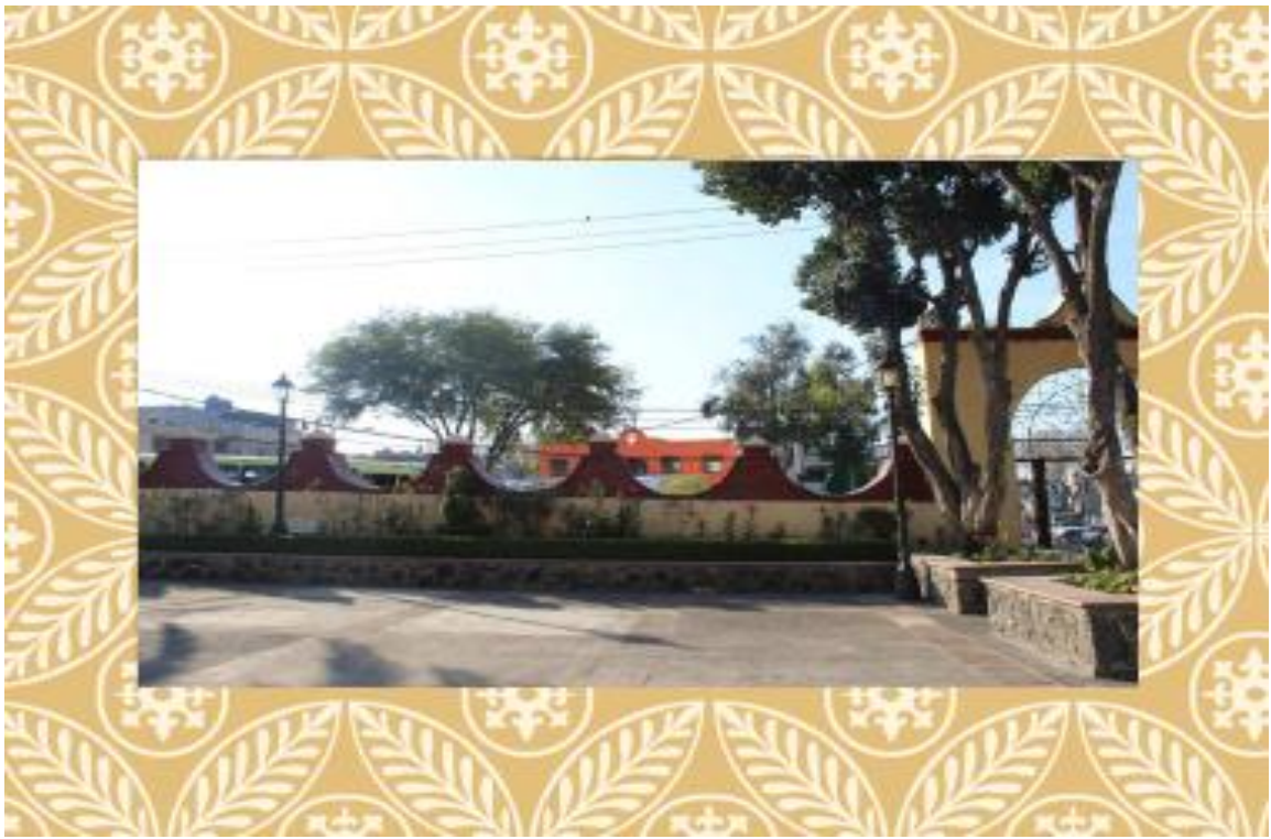
Foto 15. Explanada de la Iglesia del pueblo: Santa Ana Tlacotenco.