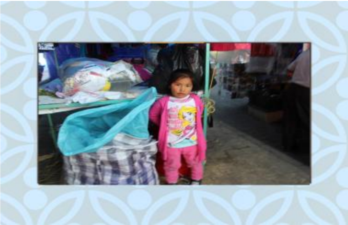
FOTO 11. Niña tlacotenca