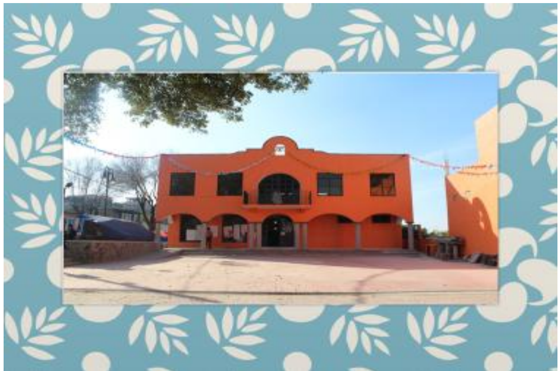
FOTO 4. Oficinas del Coordinador de Enlace Territorial en Santa Ana Tlacotenco y plaza pública.