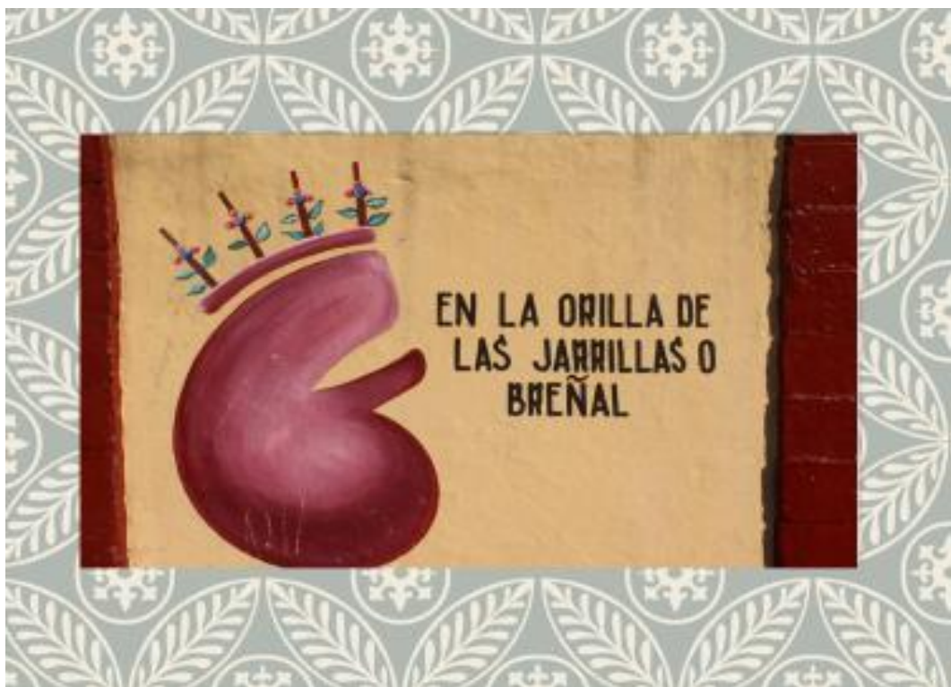
FOTO 1. Toponimia: Santa Ana Tlacotenco: en la orilla de las jarrillas o breñal.