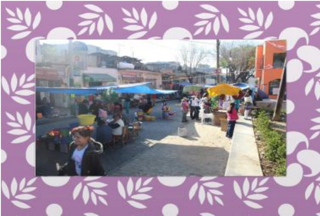
FOTO 9 y 10. Plaza de los Domingos que se encuentra a un costado de la oficina del Coordinador de Enlace Territorial.