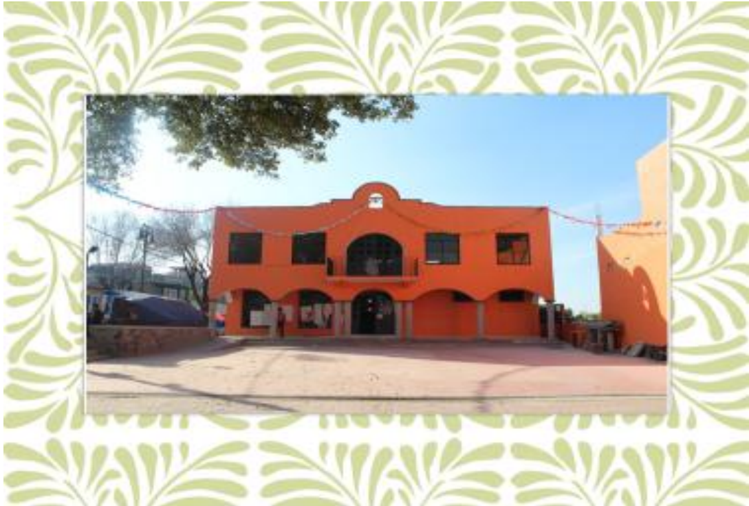
FOTO 3. Oficinas de la Coordinación de Enlace Territorial remodeladas 2013.