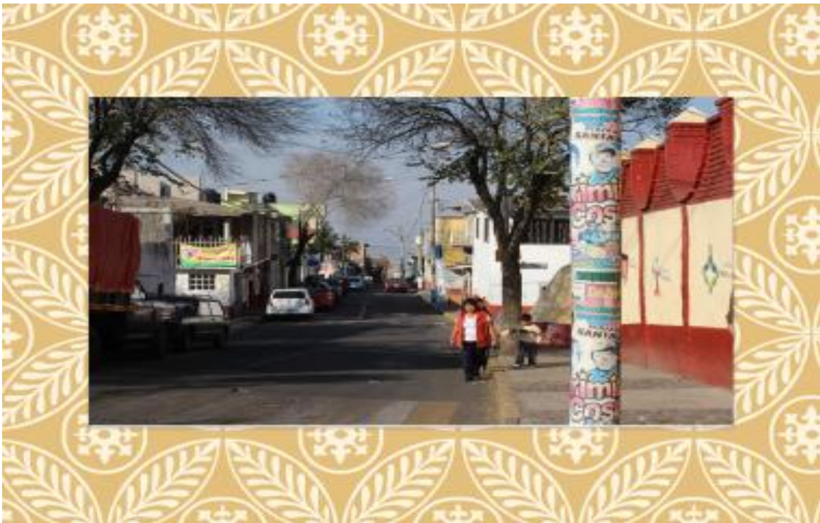
Foto 16. Afueras de la Iglesia del pueblo originario Santa Ana Tlacotenco.