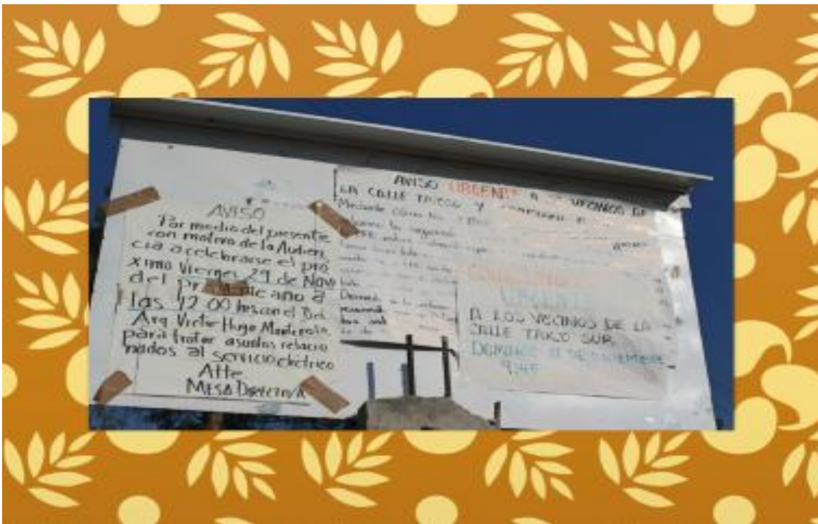
Foto 18. Avisos de Asambleas de vecinos.