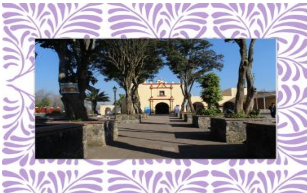
FOTO 14. Iglesia del Pueblo originario Santa Ana Tlacotenco.