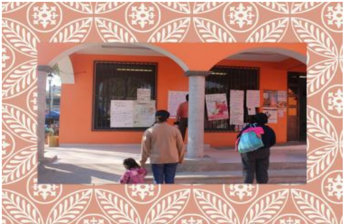
FOTO 8. Habitantes del pueblo originario Santa Ana Tlacotenco leyendo los anuncios públicos.