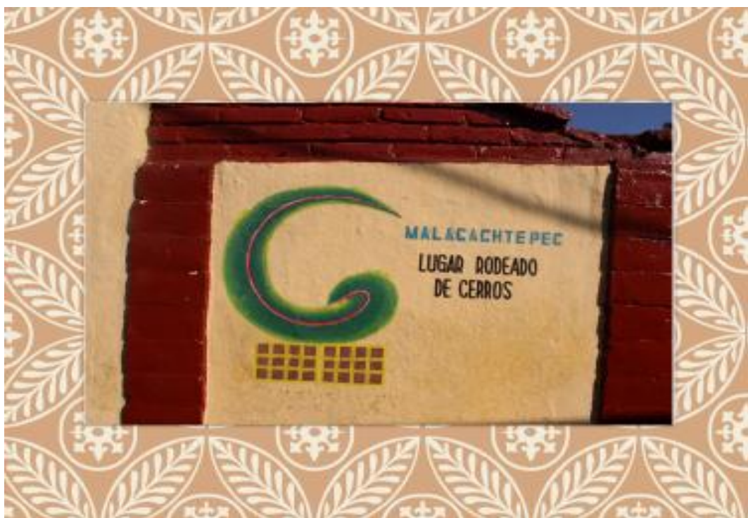
FOTO 2. Toponimia: Milpa Alta, Malacachtepec: Lugar rodeado de cerros.