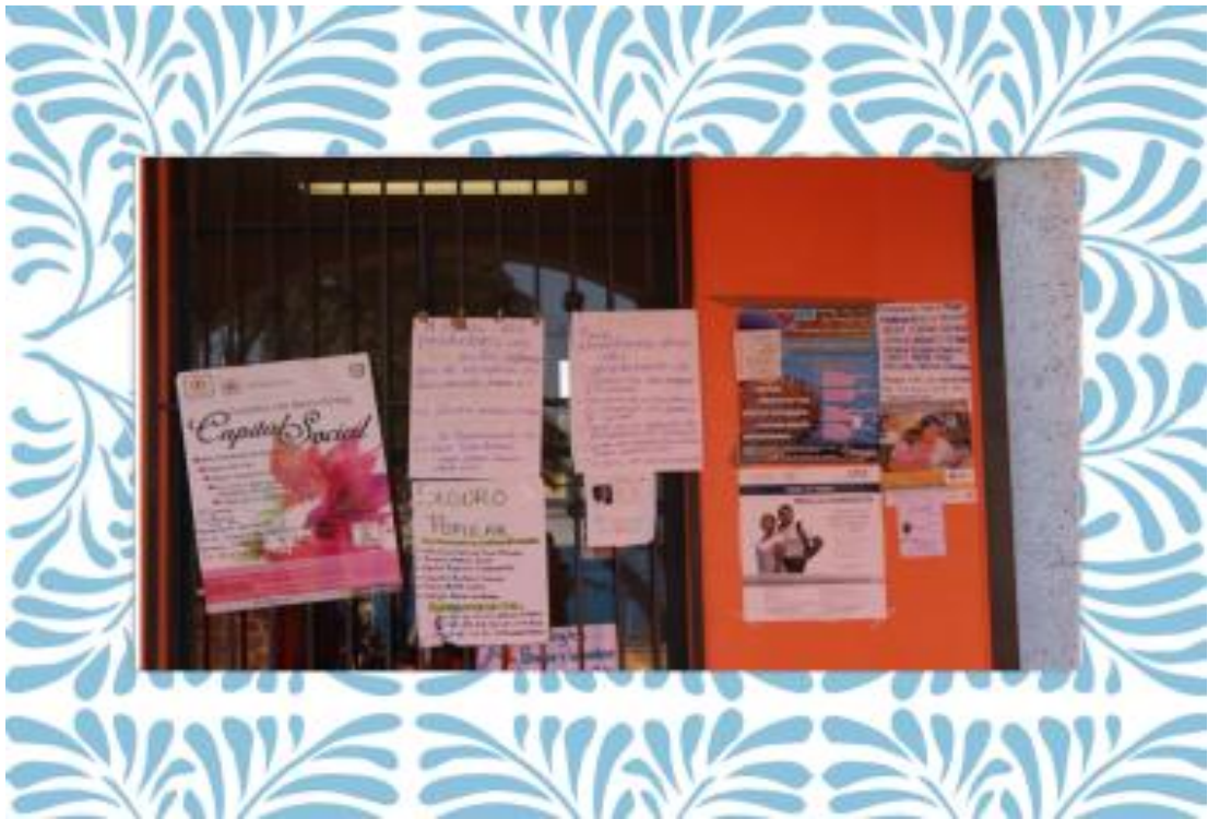
FOTO 7. Anuncios afuera de las oficinas de la coordinación de Santa Ana Tlacotenco.