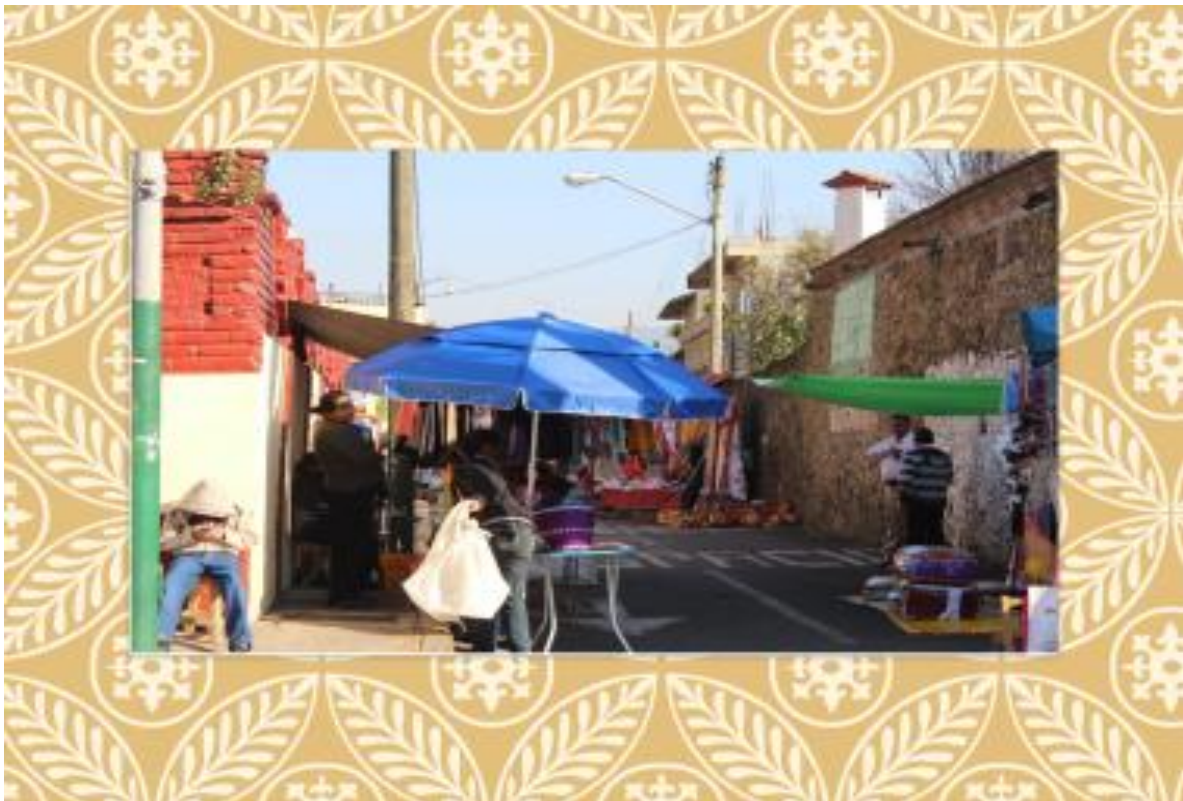
FOTO 12. Plaza a un costado de la iglesia de Santa Ana Tlacotenco.