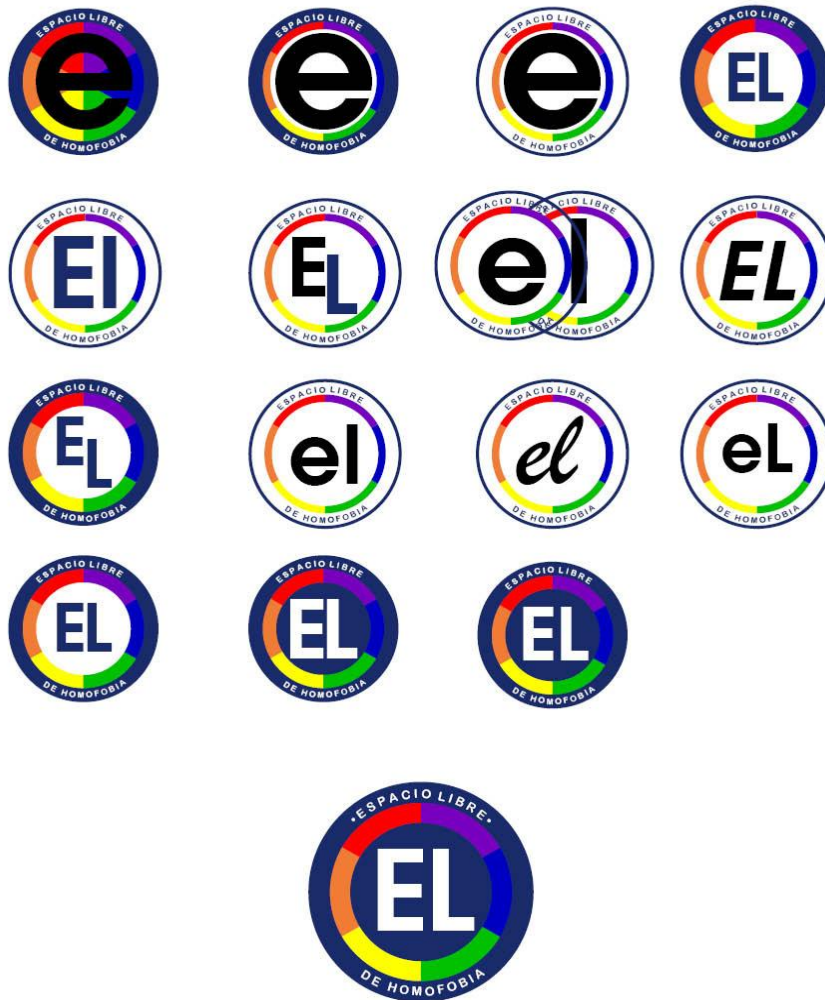
Arial Rounded MT Bold 7.5 pt ITC Avant Garde Gothic Demi 67.5 pt

A continuación se pueden observar las pruebas de diseño que se realizaron para elegir el logo que identificará a la revista “Espacio Libre”, seleccionando el último como definitivo por su claridad, contraste y eficacia para la revista.