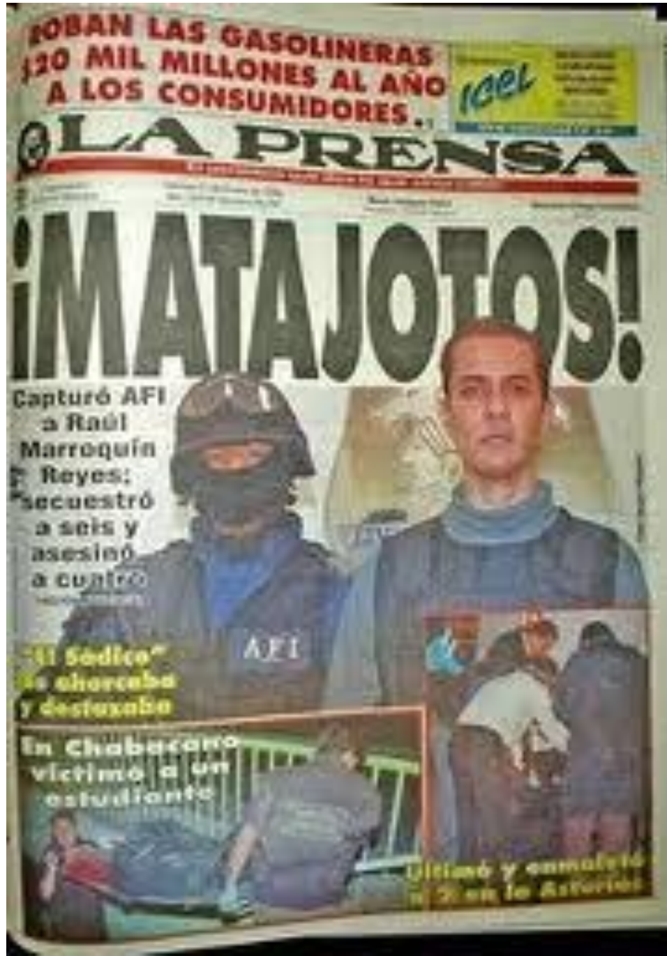
Portada del Periódico "Matajotos" La Prensa.