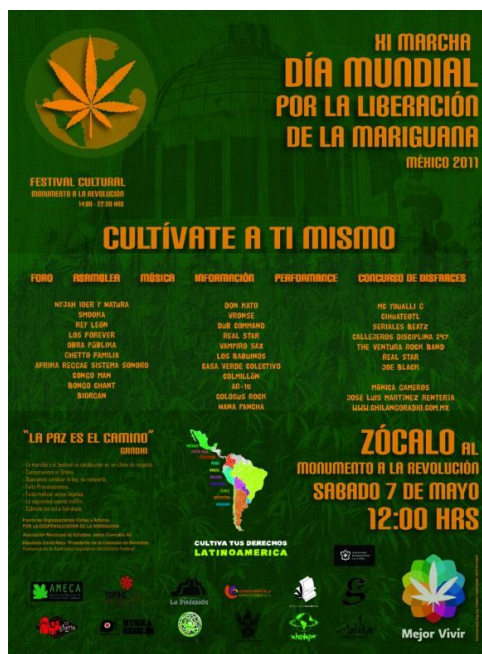
Cartel de la marcha de la legalización de la marihuana del año 2011

Ejemplificando lo anterior, podemos mencionar la marcha de la legalización de la marihuana en la Ciudad de México, que se realiza año con año donde diversos colectivos se unen para dar paso a esta marcha y poner en claro las problemáticas que trae consigo la no despenalización de la misma, realizando diversas actividades culturales, informativas y musicales, donde diversos grupos de reggae o Sound System figuran en el evento con sus líricas.