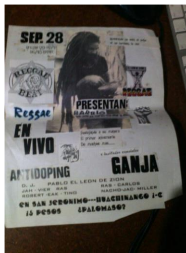
Flyer hecho a mano 10