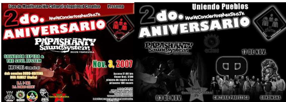
Flyer del Ghetto México, en el año 2007 uno de los últimos eventos que tuvo, para después emigrar cerca del Zócalo, como parte de la celebración estuvieron grupos como Papashanty Sound System de Venezuela, Salvador Soul System y Dj Ital and Bongo Chant.

“Bastante han tenido, si han tenido sus contras porque en primera nos tocó vivir un poco la parte de la imagen, la imagen en una sociedad hoy relativamente conservadora, porque en primera pues veían el humo de la marihuana, los dreadlocks un poquito los satanizaban un poco, quizá todavía pero ya no es como antes, entonces esos fueron ciertos contras que a su vez cuando tu ibas o vas y solicitaban un permiso no te lo autorizaba tan fácilmente o no lo veían con buenos ojos, ahora han cambiado ciertas cosas pero sigue habiendo ciertos aspectos que no lo permiten de decir patrocinadores por ejemplo, no es tan fácil, nosotros no hemos trabajado por medio de patrocinadores, ha sido autogestivo, ha sido autónomo, independiente y la verdad es que eso también es la esencia de esto, porque nosotros de alguna forma como te mencionaba hace un momento es una forma autodidacta de hacer las cosas entonces mantener ese perfil, esa actitud nos ha hecho tener más fuerza eso creo que han sido ciertas trabas la parte del apoyo externo, la parte de un apoyo a lo mejor del gobierno o de algún patrocinador”. (Adrián; Noviembre;2016)