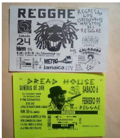
Flyer Dread House, febrero 1999