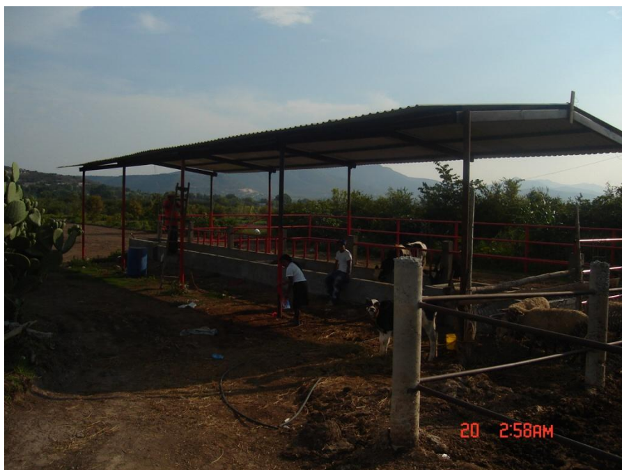
Establo de la familia Botho Ramírez.