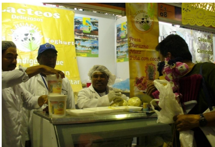
Venta de lácteos en la Ciudad de México

Actualmente la leche de los productores del Centro de Acopio “La Flor de Huapilla” es vendida un proveedor de Tulancingo y vendida a empresas lácteas. Además de la venta de la leche en la comunidad, los productos lácteos son comercializados en las tiendas de la misma, balnearios y mercados de algunas regiones del Valle y a través de la DCI, entregan productos lácteos en los albergues. Por otro lado, la manera que han encontrado para la comercializar, vender e introducir al mercado sus productos es a través de asistir a ferias o eventos organizados por algunas organizaciones, instituciones de gobierno y/o privadas.