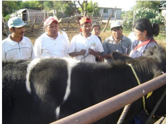
Taller de capacitación a hombres para la elaboración de lácteos.