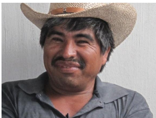
Jesús Hernández.