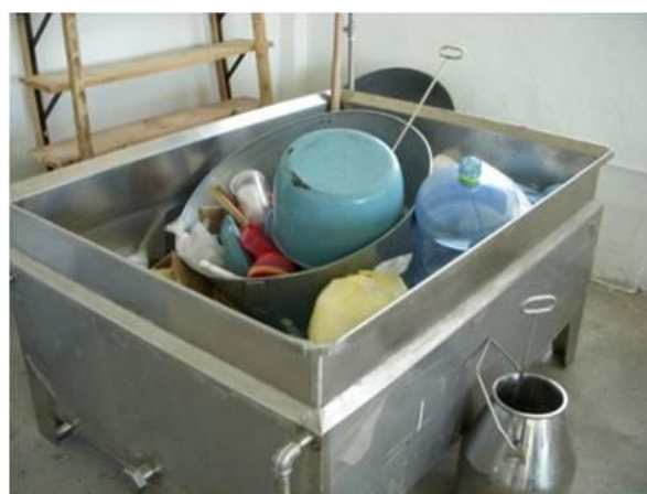
Apoyo de diversos materiales para la elaboración de lácteos.

En este mismo periodo y debido a la deuda que tenía el industrial de Tulancingo, el grupo decide aceptar como parte del pago, materiales que necesitaban para el centro.