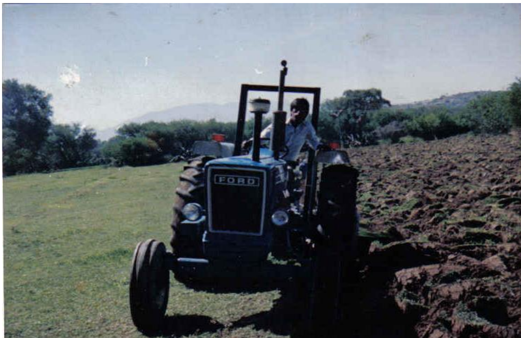
Trabajando el tractor en Pueblo Nuevo.