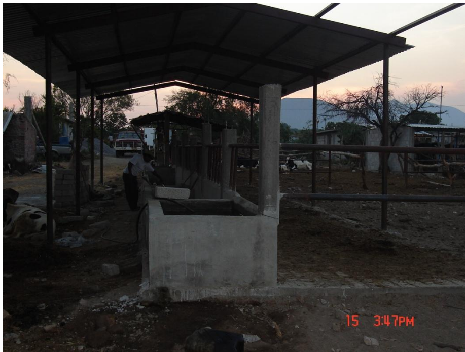
Mejoramiento de establo familiar.

Después de haberse consolidado como Sociedad S. S. comenzaron a gestionar recursos ante gobierno del estado, la secretaría de agricultura y la CDI, para la construcción del centro de acopio. Los primero apoyos que lograron como Sociedad constituida fueron materiales para mejorar sus viviendas y materiales para la construcción o mejoramiento de los establos familiares.