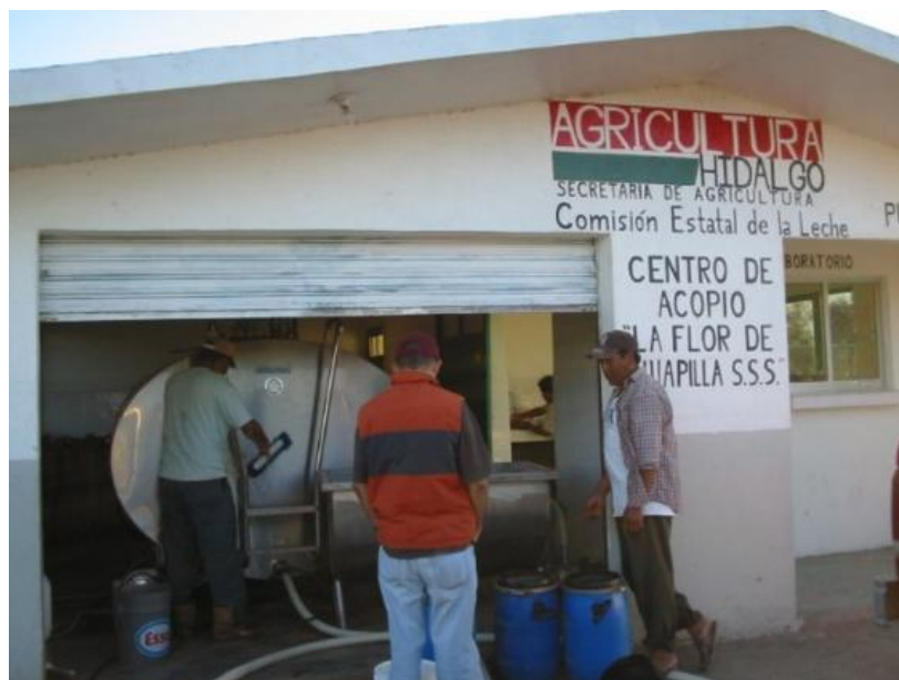
Acopio de leche en el Centro La Flor de Huapilla.