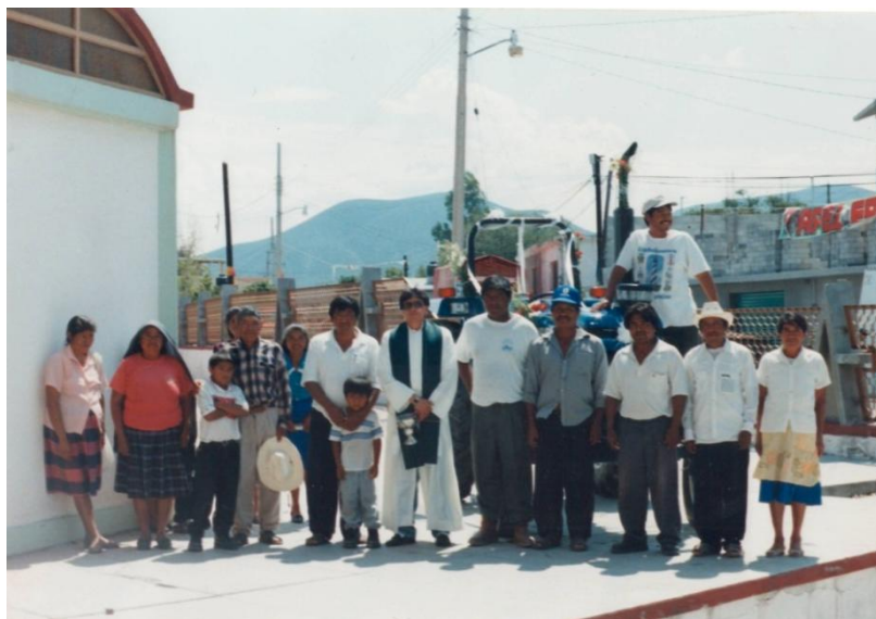
Tractor financiado por Fondo Nacional de Empresas en Solidaridad (FONAES).