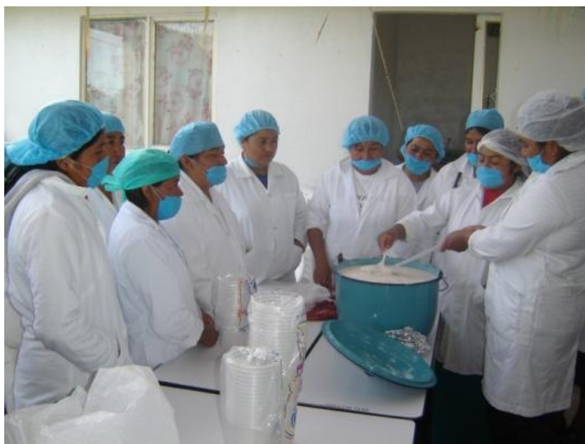
Elaboración de lácteos en el taller de capacitación a mujeres.

mujeres y las compañeras se sintieron motivadas porque a veces no nos pagaban la leche, o no llegaba la pipa para llevarla con el industrial o cuando venía no se llevaba toda la leche del tanque porque no cabía en el tanque y entonces la leche se descomponía; entonces las compañeras también se sintieron motivadas a hacer y a prepararse y aprender a hacer quesos” (Silvia Damián, Centro de Acopio Lechero “La flor de Huapilla”)