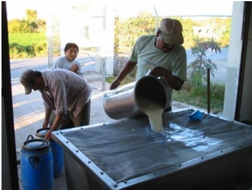
Acopio de leche en el Centro La Flor de Huapilla.

Actualmente, a través de la Comisión Estatal de la Leche el Centro de Acopio Lechero “La Flor de Huapilla”, recibió el apoyo para el laboratorio y vende la leche con un industrial de Tulancingo, además cuenta con el apoyo de una pipa para el traslado del líquido, financiado por el centro “La Flor de Huapilla”, y de una persona que se encarga de analizar la calidad de la leche (laboratorista).