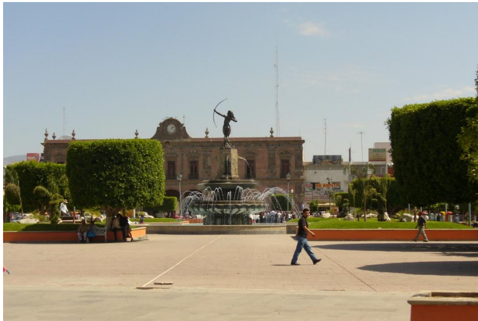
Cabecera municipal de Ixmiquilpan, Hgo.

El municipio de Ixmiquilpan se encuentra localizado en la parte central poniente del estado de Hidalgo; su superficie es de aproximadamente 239 kilómetros cuadrados. De acuerdo a la ubicación geográfica el clima del municipio es semiárido. Colinda al norte con los municipios de Zimapán, Nicolás Flores y Cardonal; al este con Cardonal y Santiago de Anaya; al sur con Santiago de Anaya, San Salvador, Chilcuautla y Alfajayucan y al oeste con Alfajayucan, Tasquillo y Zimapán. Las principales localidades con las que cuenta son: Panales, el Tephé, Maguey Blanco, Orizabita, el Alberto, Dios Padre, Julián Villagrán, Tatzadhó y la comunidad de Pueblo Nuevo, entre otras. ( http://ixmiquilpan.hidalgo.gob.mx/ )