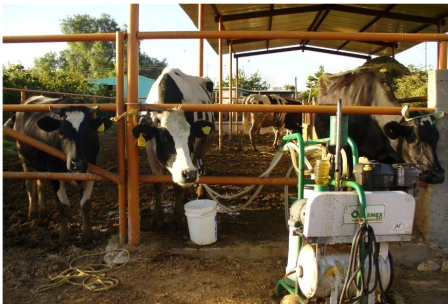
Apoyo de equipo para ordeña.