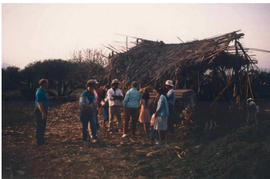
Intercambio de experiencias.

A la par que se formaron los grupos de establos, los comités de la unión de establos organizaban reuniones mensuales de intercambio de experiencias en distintos establos de cada comunidad. En cada intercambio, las mismas personas que formaban los establos colectivos, se revisaban las condiciones de los corrales y de las vacas, se intercambiaban opiniones y se daban sugerencias para el mejoramiento de los establos, el cuidado y la alimentación de los animales.