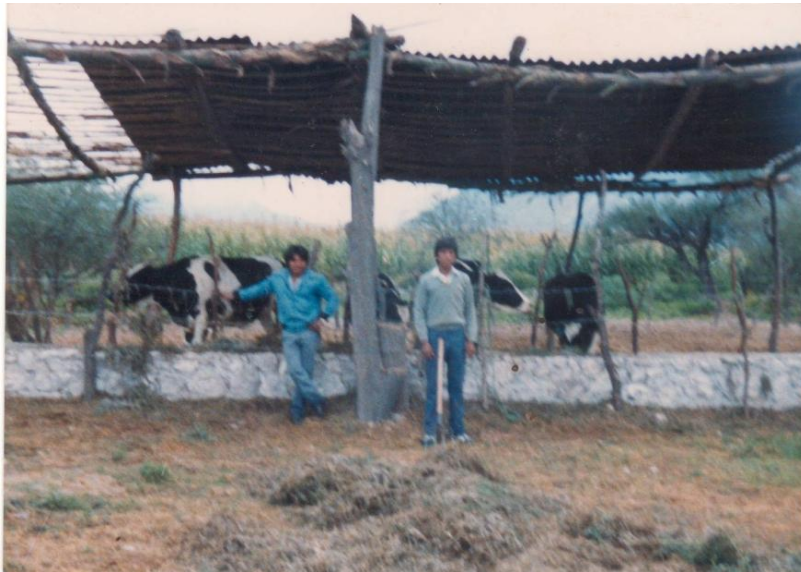
Inicio de las Cadenas de Vida en Pueblo Nuevo.