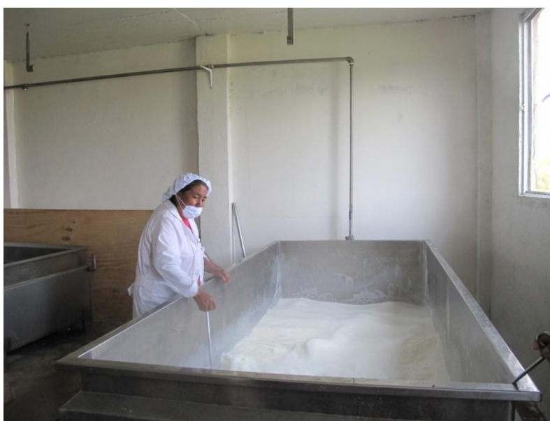
Preparación de leche para la elaboración de queso.