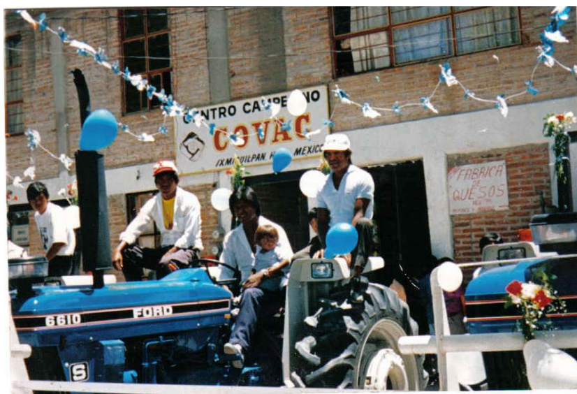
Apoyo de tractores de la Embajada de Canadá.

“... primero nos dieron un -tractor- por la embajada de Canadá. Entonces no nos abastecíamos con ese tractor porque éramos muchos grupos, entonces formamos un comité y ese comité iba a buscar la manera de cómo buscar más apoyos...” (Jesús Pérez, Centro de Acopio Lechero “La flor de Huapilla”)