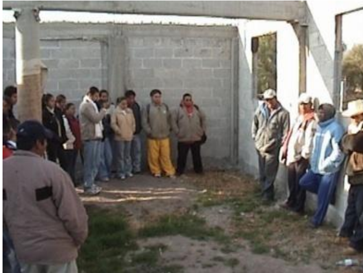
Ampliación del Centro de Acopio Lechero La Flor de Huapilla.

A partir de este periodo la Sociedad de Solidaridad Social “La Flor de Huapilla” comienza a gestionar varios proyectos para obtener materiales para echar andar el proyecto de la quesería. A través de Servicios para el Desarrollo A. C. (SEDAC), CDI, FSB y el gobierno del estado de Hidalgo la S. S. S. S. ha podido consolidar y mantener el Centro de Acopio Lechero, y los socios se ha beneficiado del mismo.