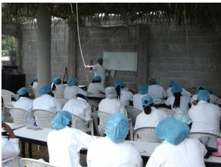
Taller de capacitación a mujeres para la elaboración de lácteos.

“... hicimos un grupo con nuestras esposas, es un grupo de mujeres que recibieron capacitación de cómo hacer yogurt, queso, entonces ya tienen un trabajo, aunque sea poco pero tienen. Son las puras mujeres de los socios...” (Salvador Cazuela, Centro de Acopio Lechero “La flor de Huapilla”)