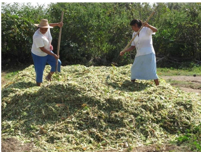
Preparando el silo para alimentar las vacas.