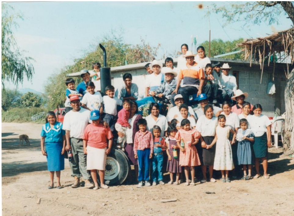
Grupo La Flor de Huapilla al recibir el apoyo del tractor.