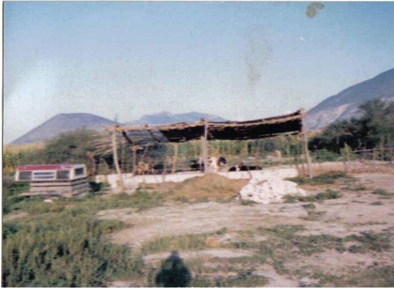
Establo Colectivo en Pueblo Nuevo.

Uno de los retos a los que se enfrentaron como grupo con la organización y comités de establos, era que por ser jóvenes no les creían que fueran capaces de comprometerse con el trabajo y cuidado de los animales; y sobre todo, ser responsables para pagar el préstamo de la “Cadena”. Considero que esta situación la seguimos viendo actualmente, pues la mayoría de jóvenes en busca de un trabajo, dispuestos a salir adelante, a hacer experiencia y conseguir mejores ingresos económicos para mejorar sus condiciones de vida; en la mayoría de los casos son subestimados y no encuentran oportunidades para trabajar.