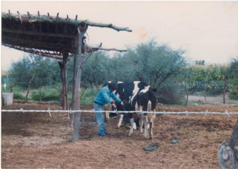
Inicio de las Cadenas de Vida en Pueblo Nuevo.

Algunas de las razones que tenían ambos grupos para trabajar en el proyecto de “Cadenas de Vida” eran: auto-emplearse para no separarse de su familia al ir a trabajar fuera de su comunidad, inclusive fuera del país; mejorar la alimentación familiar, principalmente la de los niños y niñas; y aprovechar el forraje que sembraban para alimentar las vacas, ya que en esos años, por el intermedialismo, la comercialización del forraje no se pagaba a un precio justo.