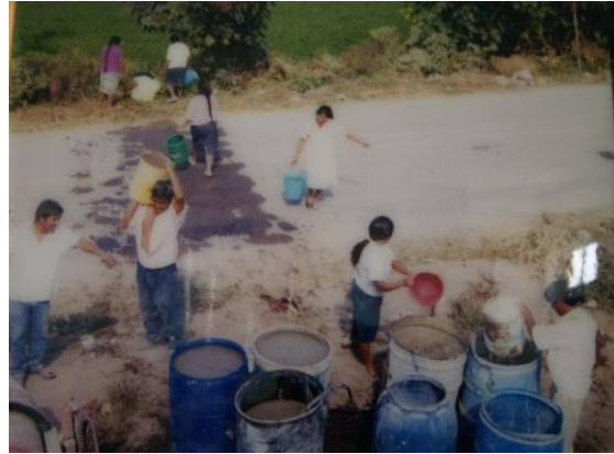
Faena para la construcción del Centro de Acopio Lechero La Flor de Huapilla.

En el año 2000, el grupo construyen el centro de acopio lechero, a través de “faenas”, con el apoyo de un proyecto que el gobierno del estado les otorgo a los socios del grupo para la construcción de viviendas, y obtienen el tanque enfriador financiado por medio de la Secretaría de Agricultura, Ganadería, Desarrollo Rural, Pesca y Alimentación (SAGARPA), con el 50% del apoyo- y por medio de un crédito de Fideicomisos Instituidos en Relación con la Agricultura (FIRA).