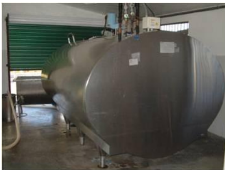
Tanque enfriador para almacenar la leche.