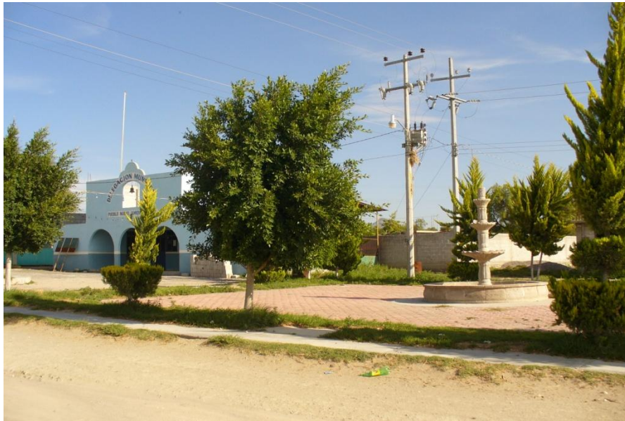
Delegación comunitaria de Pueblo Nuevo, Ixmiquilpan, Hgo. Foto: SEDAC, 2009

En cuanto a la economía de la comunidad, Pueblo Nuevo está ubicado en una de las muchas zonas de riego alimentadas en su mayoría por las aguas de los manantiales que existen en la comunidad y algunas áreas por aguas negras que viajan de la ciudad de México que corren por el Río Tula. Una de las ventajas que viven los habitantes de la comunidad con la entrada de este sistema de riego es la existencia de oportunidades para trabajar el campo, cosechar sus tierras, mejorar sus ingresos y disminuir la migración de familiares a los Estados Unidos.