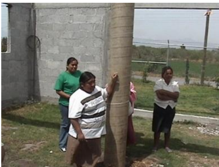
Ampliación del Centro de Acopio Lechero La Flor de Huapilla.

A la par de las capacitaciones surge una nueva necesidad, la sociedad necesitaba un local de trabajo, maquinaria y equipo para poder empezar a trabajar. Así que del recurso que recibieron de las becas que les otorgo el ICATHI a través de la secretaría del trabajo y la CDI durante las capacitaciones, comenzaron a construir un local para hacer los lácteos.