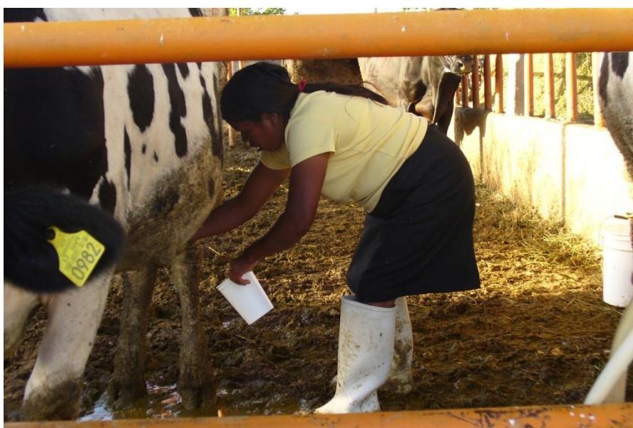
Ordeñando las vacas.

En el año de 1999 ambos grupos deciden renunciar a la Unión de Establos Colectivos y se constituyen como Sociedad de Solidaridad Social (S.S.S.), comenzando a trabajar como sociedad independiente. Para conformar la sociedad y poder recibir más apoyo, solicitaban ser mínimo 20 socios. Actualmente la sociedad sigue conformada por 30 socios, entre ellos 15 hombres y 15 mujeres. Cuando forman la Sociedad de Solidaridad Social, comienza la participación más formal de las mujeres. Al inicio de esta experiencia, la participación de las mujeres correspondía al apoyo que podían brindar a sus esposos, en cuanto al cuidado de las vacas y en el campo.