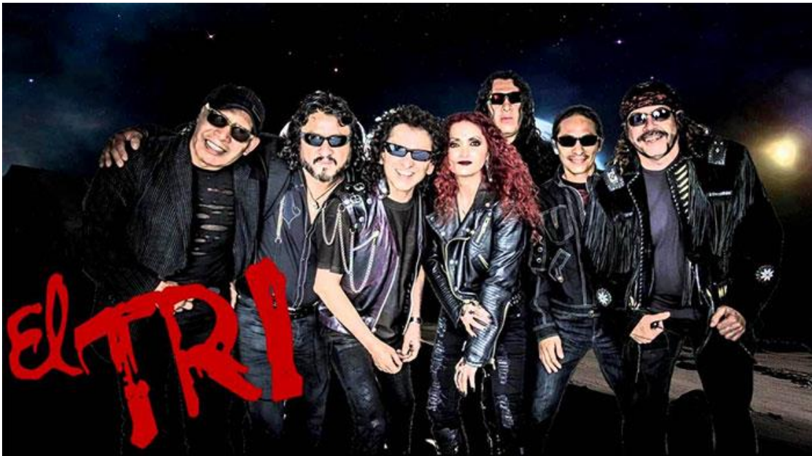
El Tri: cinco décadas rockeando .

Las demandas se quedaron en la memoria de aquéllos que escucharon o aún escuchan las canciones de la agrupación musical. El país necesita acciones sociales más que creaciones musicales que expresen el desacuerdo.