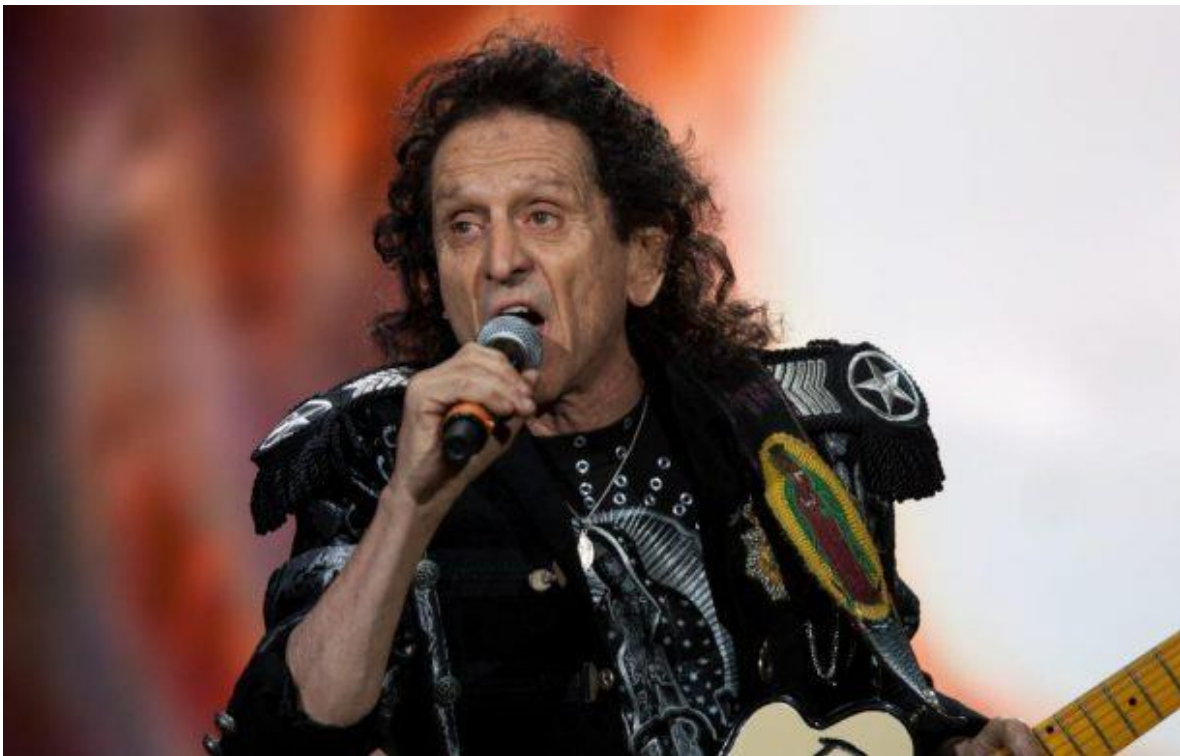
La virgen de Guadalupe, estandarte de Alex Lora.

La resistencia entonces figura como la contraparte donde se hallan, se apropian y se articulan las relaciones de poder. “En tal sentido, ‘resistir’ no es ‘aguantar’ o ‘soportar’ una fuerza, sino oponérsele activamente; es decir, enfrentarse y bloquear sus engranajes, ubicándose en todas partes dentro de la red de poder (del Valle, 2012, pág. 163).