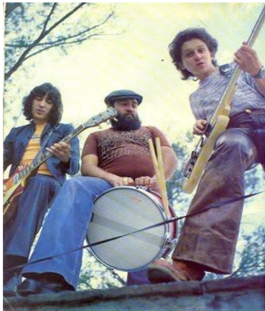
Three Souls in My Mind durante la década de los sesenta, al inicio de la agrupación.

El último de los ejes aborda el rock de El Tri, el cual ha demostrado que durante más de cinco décadas ha sido un generador de identidad para un público enfocado, principalmente, en la gente de barrio. Además, de que se convirtió en el portavoz de cargas ideológicas enfocadas a desigualdades sociales, diversas manifestaciones de abuso y represiones, entre otras. Por último, se parte de dos canciones de la ya mencionada banda, que, a pesar de estar desvinculadas en contexto, muestran el reflejo de una realidad que se vivió en nuestro país.