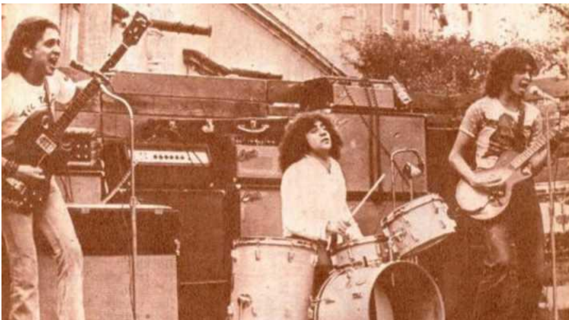
Primeras presentaciones de Three Souls in My Mind.

ideológica que dejan los mensajes de canciones en las sociedades de distintos contextos.