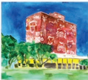
Lani/ Educación pública