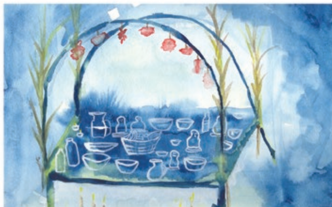
San Miguel, Ilhowi kie yēdz ga Rxhiti Nis, Chiapas.