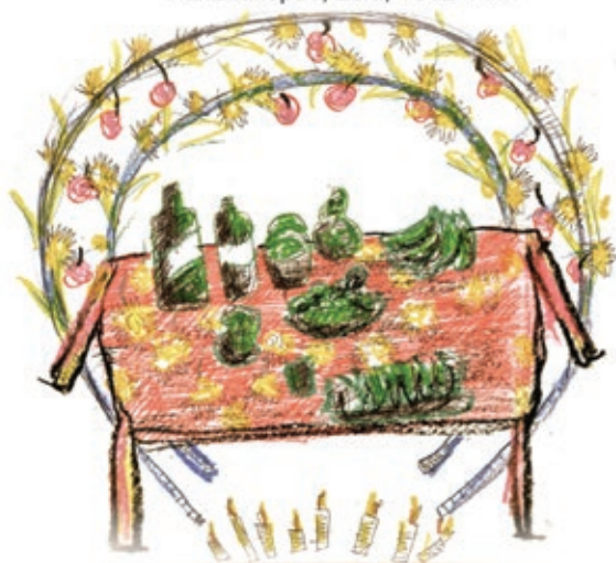
San Juan Tabaa, Lu'a.