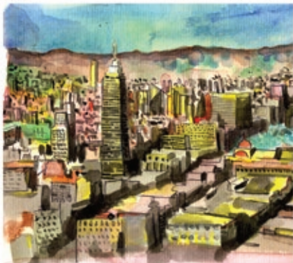
Lani/ La Ciudad de Mexico