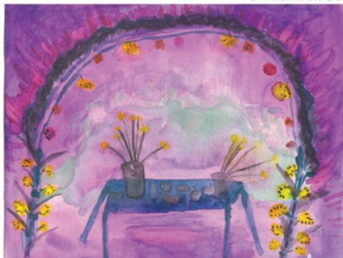
Tamazulapan Ihen Miahuatlàn, Lu'a