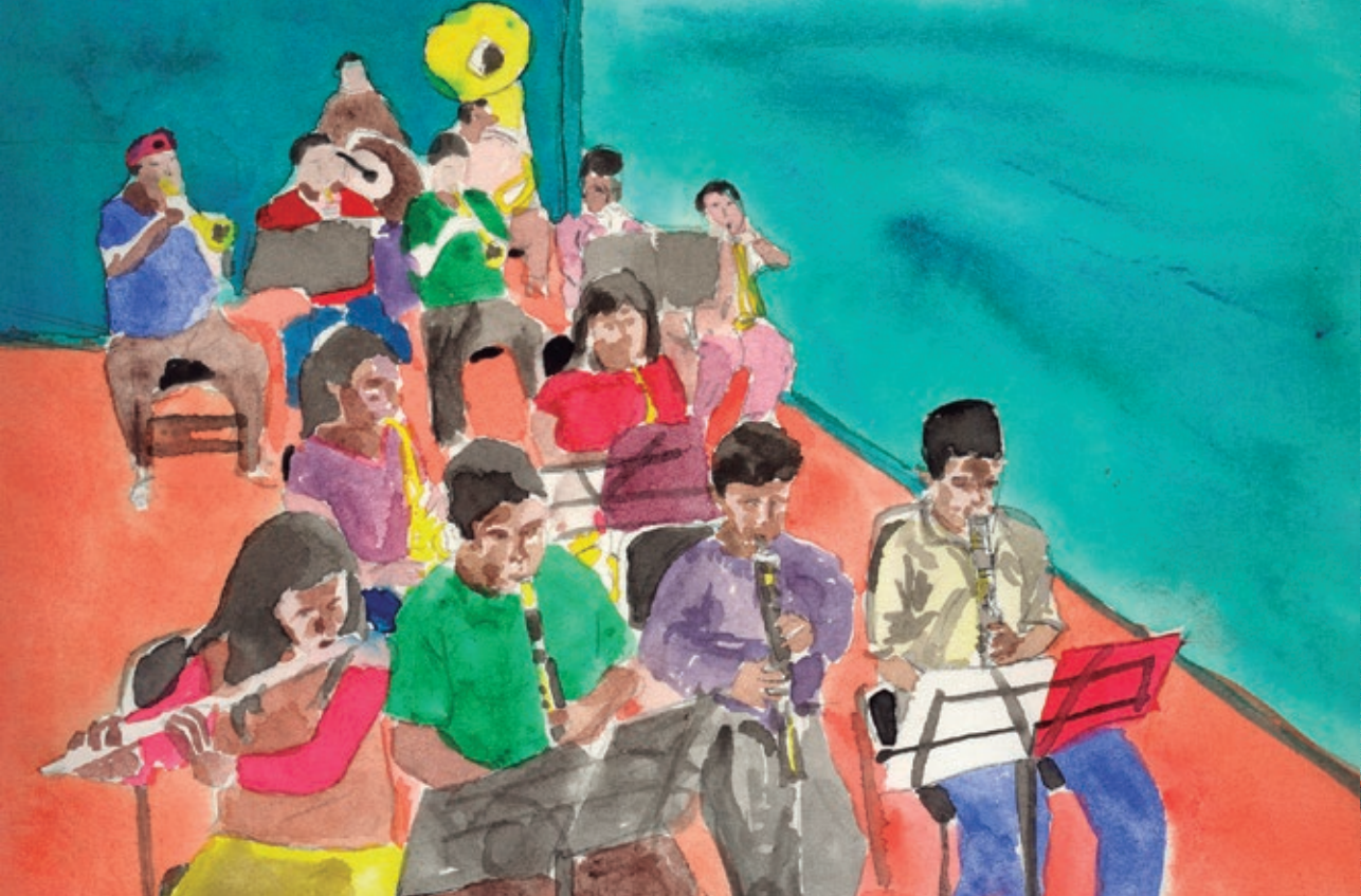
Banda de música

Las monografías escolares son un material con el que crecí. Me cautivaban por sus ilustraciones y su retícula. Podías encontrar cualquier tema y los maestros de la primaria te pedían que las compraras para hacer tu tarea y para actividades en clase.