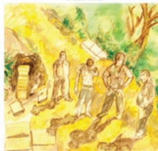
Uzajhuj Nies/ Limpia del camino