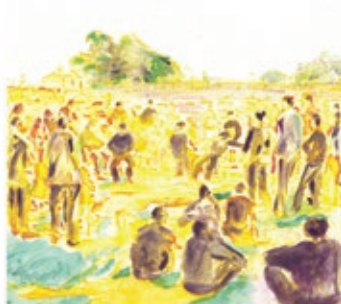
Olin Ulow/ Asamblea