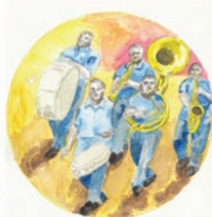
Si Musi/ Banda