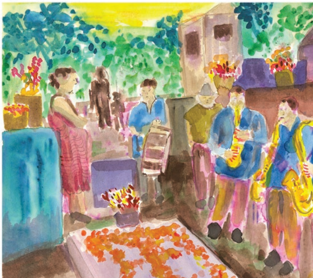
Bi musk lu ba/ Banda en panteón