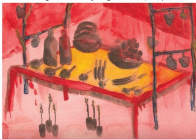
Tlahuitoltepec, Lu'a, Yēdz Mixh