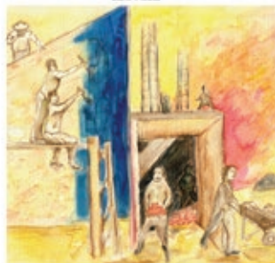
Tunhe yu'uskue/ Construcción de la escuela