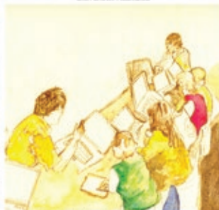
Olin Used Komputadora/ Taller de cómputo