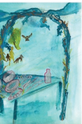
Lu'a, Yēdz Mixh