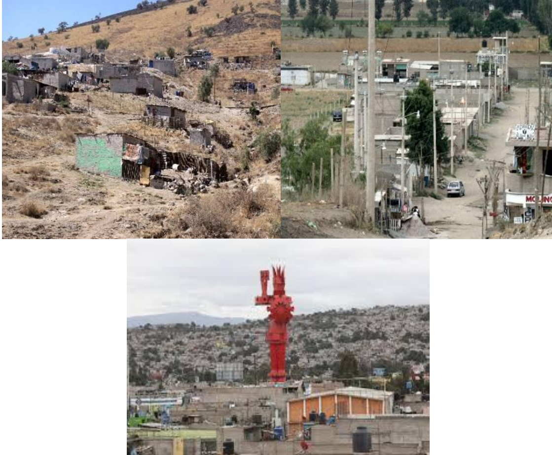
Ilustración 3. Proceso de urbanización, comenzando por viviendas de autoconstrucción en espacios irregulares y proliferando en espacios urbanos desordenados sin planificación.

Ante la ausencia de oportunidades de empleo en el ámbito local gran parte de la población trabaja fuera del municipio convirtiéndolo en uno más de los inmensos dormitorios perimetrales de la zona centro; es considerado como un municipio dormitorio, ya que el 65.3 % de la población se traslada al D.F. y a la zona industrial del Estado de México, (Tlalnepantla y Cuautitlán Izcalli) para conseguir el sustento familiar, lo que les implica un mayor gastos económicos y físicos (www.miambiente.com.mx 2015). Es así que los habitantes de estas áreas no sólo recorren cotidianamente largas distancias para trasladarse a sus trabajos, sino que sus niveles de ingreso revelan la alta precariedad de su inserción laboral.