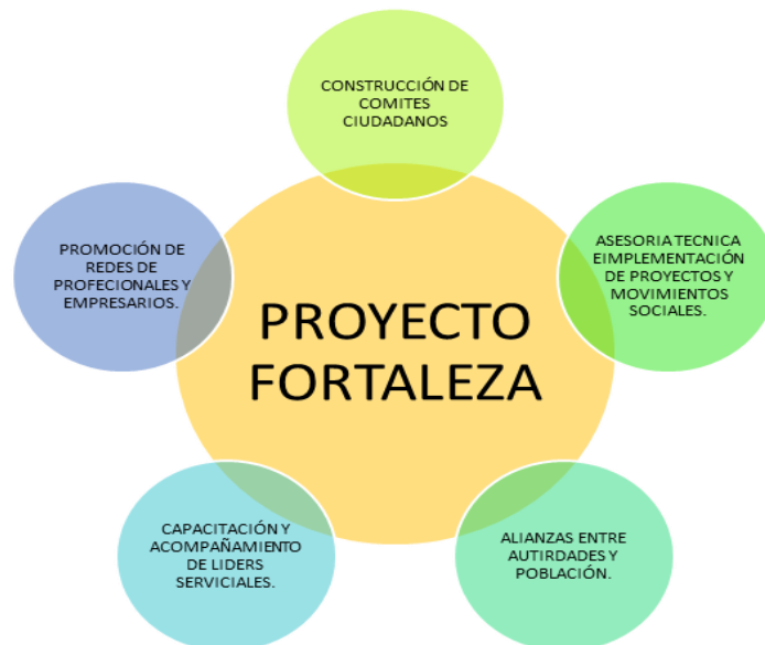
Ilustración 8 Líneas de acción del programa Fortaleza.

Crean redes y alianzas estratégicas de profesionistas y funcionarios interesados en la transformación integral de espacios sociales, que fomenten coaliciones y movimientos ciudadanos sin fines partidistas, que permitan generar un poder ciudadano capaz de incidir en las políticas públicas y recuperar espacios de participación ciudadana, que sea capaz de incidir en las estructuras de poder y promover el ejercicio de la democracia, la equidad social y la exigibilidad de los Derechos humanos.