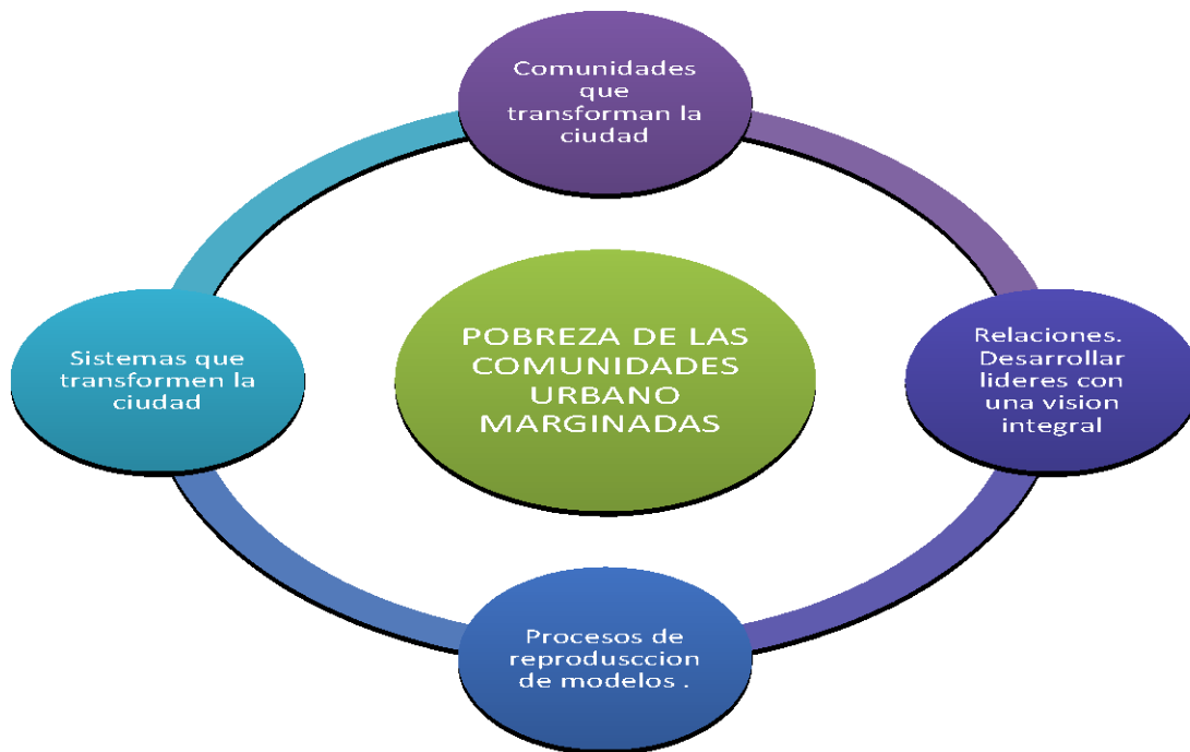
Ilustración 6 ESQUEMA DE LAS CUATRO LINEAS DE ACCION PARA COMBATIR LA POBREZA EN LAS CUM.

La meta es promover la creación, implementación y transformación para desarrollar un modelo de cambio reproducible para la transformación urbana integral que ataque las cuatro áreas de la pobreza. La finalidad es que el modelo de cambio pueda ser adaptado, reproducido y multiplicado por otras OSC, actores sociales, iglesias, etc. en donde sea necesario.