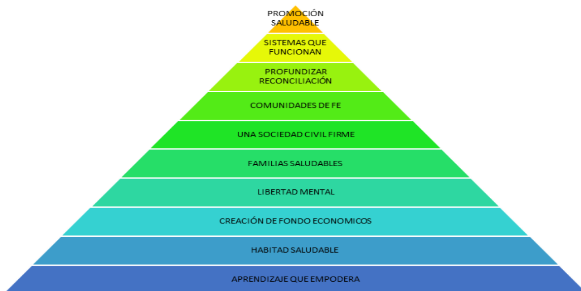
Ilustración 7 DIEZ SEÑALES QUE DEBE HABER EN EL CAMBIO INTEGRAL DE UNA CUM SEGUN TUI.

Para ellos es prioritario el liderazgo y la participación de aquellos a quienes sirven como un factor crítico para crear y sostener la transformación. Están convencidos de que las soluciones rápidas no funcionan. Tienen como propósito promover y establecer un modelo respecto a una visión integral y esperanzadora para el futuro, comprometiéndose a cumplir esta visión convertida en realidad y que impacte de una forma más amplia y profunda a una comunidad.