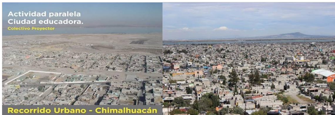
Ilustración 2. Chimalhuacán en los 90's

Sé estima que Chimalhuacán no tiene espacio físico-territorial para crecer y prácticamente el poblado se observa cada día limitado en función de la demografía, lo cual representa dificultades sociales, de ordenamiento urbano ambiental, seguridad, servicios y transporte.