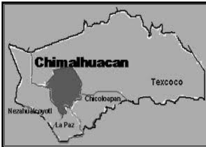
Ilustración 1. Mapa del municipio de Chimalhuacán y municipios colindantes. www.Chimalhuacan.mx

A pesar del impetuoso crecimiento económico y poblacional, el desarrollo de la entidad no ha sido homogéneo: presenta notables contrastes en cuanto a su desarrollo económico y a la calidad de vida de sus habitantes, siendo evidente el impacto que sobre este han generado sus tendencias históricas de poblamiento, ha tendido a acusar una alta concentración en dos zonas claramente identificables: la zona del valle de Toluca y la metropolitana aledaña al Distrito Federal (Moreno et al. 2013). Donde el propio desarrollo de la entidad ha hecho emerger nuevos problemas en las zonas mencionadas, así como preocupaciones cambiantes en aquellas donde la industrialización no es un fenómeno generalizable.