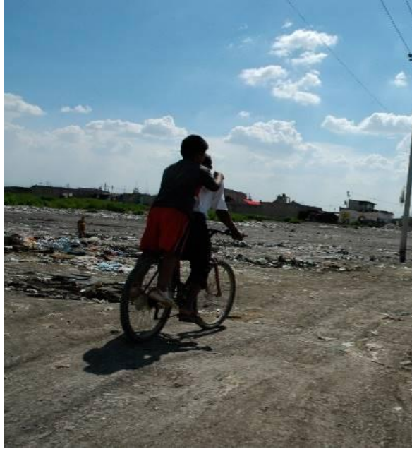
Ilustración 5 Foto tomada por TUI en las CUM de Chimalhuacán.