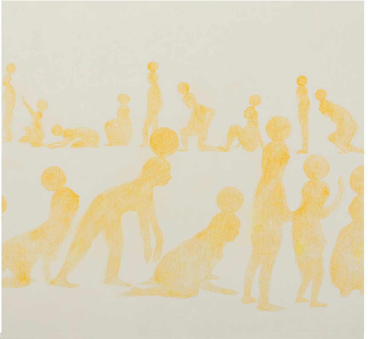
Vivir como el Sol Lápiz de color sobre papel 28 x 26 cm 2022