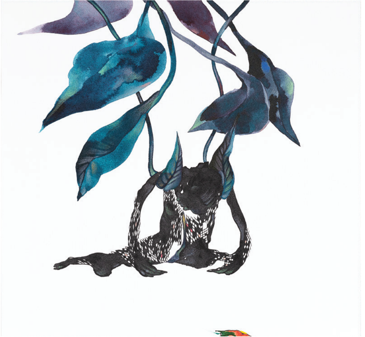
A través del dolor, soy una canción Tinta china y lápiz de color sobre papel 28 x 26 cm 2022