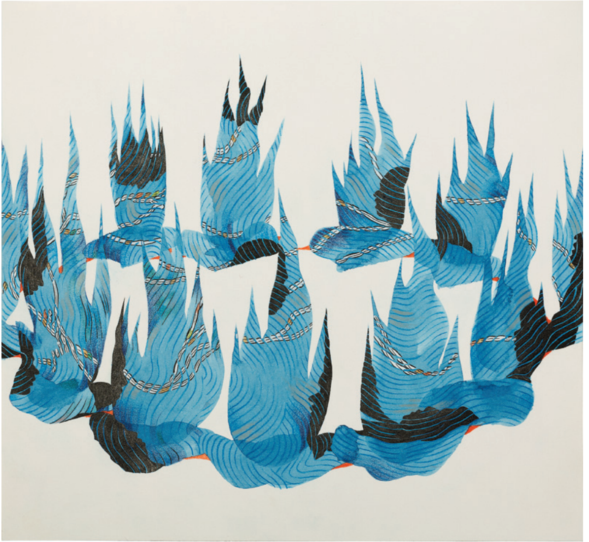
Convertirse en fuego y cantar de ahora en adelante Tinta china y lápiz de color sobre papel 28 x 26 cm 2022