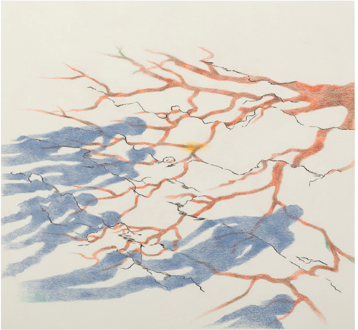
Juntos con la tierra y el sol Tinta china y lápiz de color sobre papel 28 x 26 cm 2022