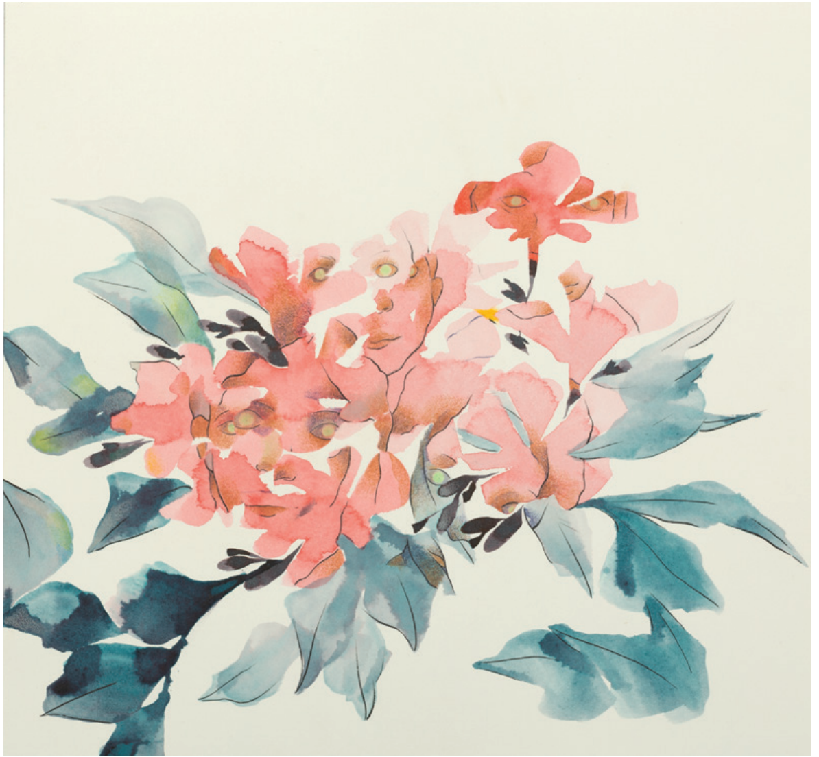
Aceptando el misterio con un corazón silencioso Tinta china y lápiz de color sobre papel 28 x 26 cm 2022