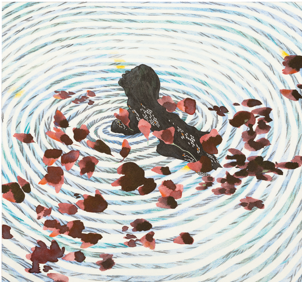
Trueno largamente esperado Tinta china y lápiz de color sobre papel 28 x 26 cm 2022