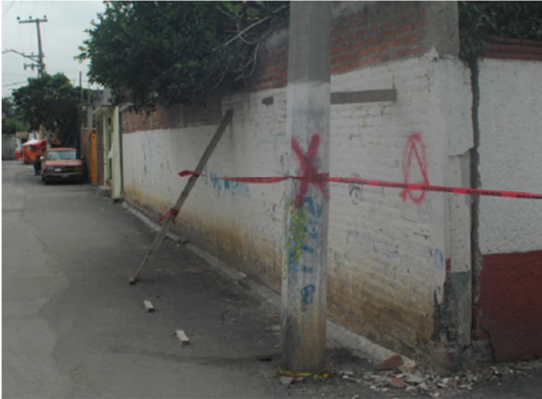
Sismo 19 S 2017. Xochimilco

En una Ciudad que privilegia la infraestructura para el uso del automóvil particular para el desplazamiento de las personas, llevar a cabo acciones o estrategias que tengan como punto de referencia el derecho humano a la movilidad significaría la posibilidad de cambiar paradigmas y avanzar, justamente, en la ejecución del derecho a la ciudad. La Ley de Movilidad cuenta con principios jurídicos que reconocen la participación de la ciudadanía en dichos temas, por lo que se sugiere su lectura cuando nos encontremos frente a una obra pública o privada que pueda afectar este derecho humano.