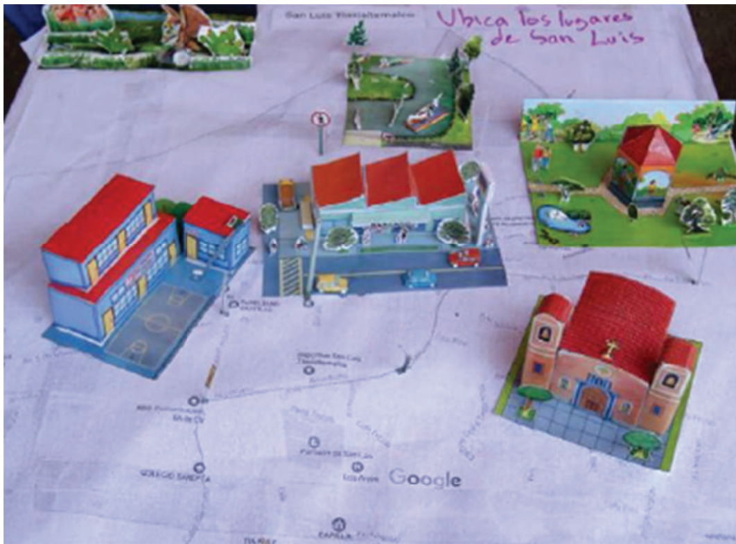
Mapeo comunitario. San Luis Tlaxiátemalco Xochimilco 2017

Si bien, en la nueva constitución de la CDMX se contempla el Derecho a la ciudad, (definido en el art. 12) el cual enuncia que: «consiste en el uso y el usufructo pleno y equitativo de la ciudad, fundado en principios de justicia social, democracia, participación, igualdad, sustentabilidad, de respeto a la diversidad cultural, a la naturaleza y al medio ambiente», así como un derecho colectivo que garantiza el ejercicio pleno de los derechos humanos, la función social de la ciudad, su gestión democrática y asegura la justicia territorial, la inclusión social y la distribución equitativa de bienes públicos con la participación de la ciudadanía (art. 12) además de la enunciación y el reconocimiento de los derechos a la participación ciudadana o la diversidad cultural (art. 57 al 59), lo cierto es que falta aún un trecho, tanto en el revertir normatividades que beneficiaran a los privados, como en su ejecución en las leyes secundarias, las cuales no deben perder la idea central de los derechos.