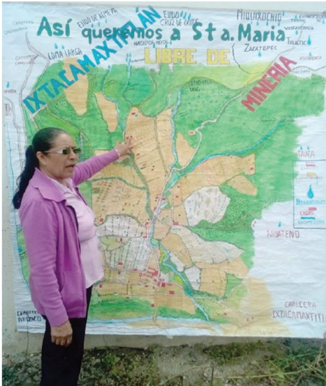
Así queremos a Santa María, Libre de minería. Territorios Vivos, Ixtacamaxtitlan, Puebla (2019)