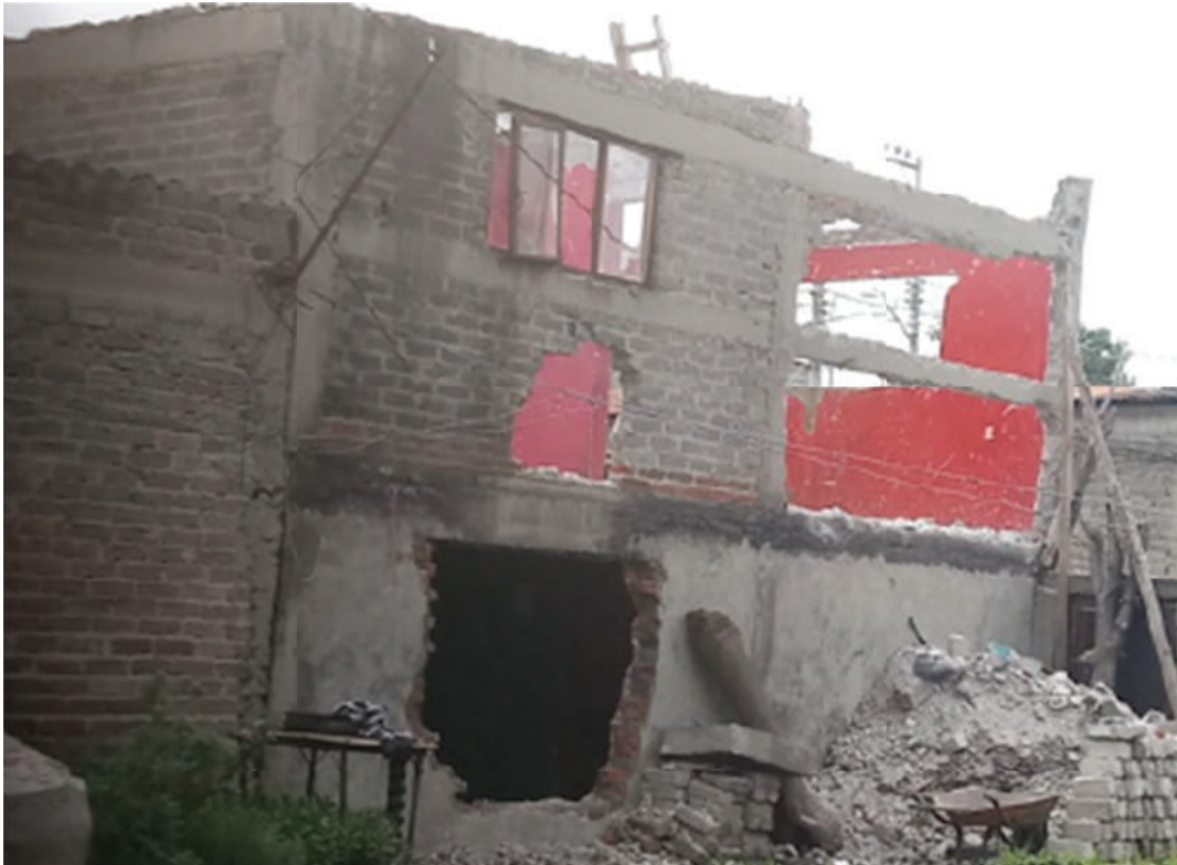
Obra irregular. CDMX

Al Sistema de Aguas de la Ciudad de México se le solicita información sobre los dictámenes de factibilidad de servicios hidráulicos.