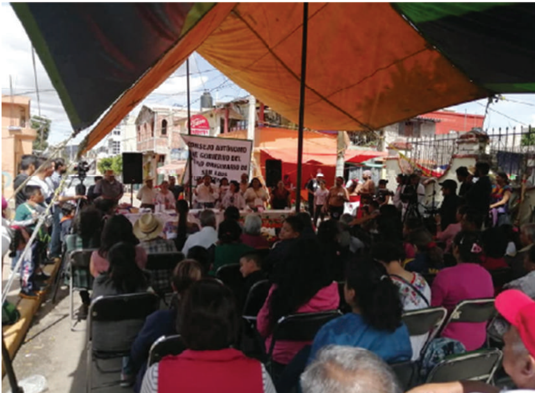
Toma de protesta del primer Consejo de Gobierno, en San Luis Tlaxialtemalco, Xochimilco, 2019

bitan esos territorios. Es a partir de los sujetos políticos o colectivos que se encuentran inmersos en el territorio que se visibilizan y se utilizan distintas herramientas legales.