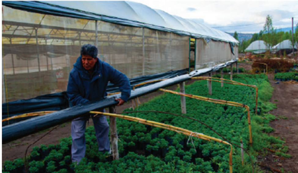
Zona chinampera, invernaderos de San Luis Tlaxialtemalco, Xochimilco, 2019