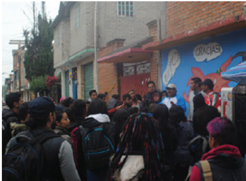
San Luis Tlaxialtemalco, Xochimilco, 2017

En la práctica el derecho a la ciudad puede referirse a la disponibilidad individual de la ciudad como bien común colectivo (uso y usufructo) y como reconocimiento de ciudadanía cotidiana (gestión democrática), así como prevalencia de la organización y disponibilidad colectiva para resolver necesidades cotidianas por encima del lucro o capacidad de especular individualmente.