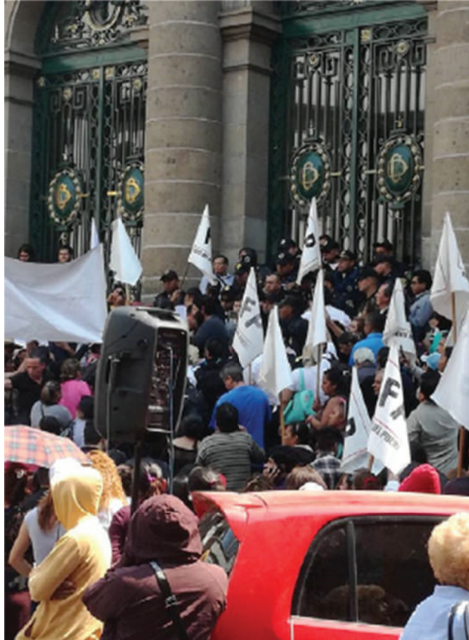
Asamblea legislativa CDMX, protesta ley de participación 2018