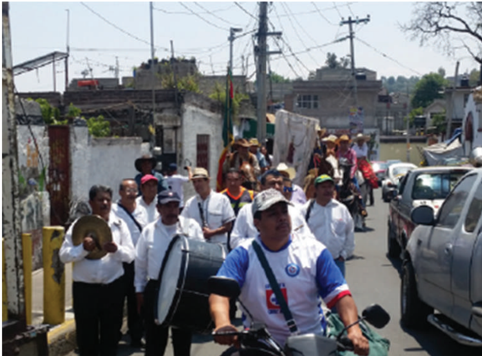
San Lucas Xochimanca Xochimilco, 2017

Al final, el desarrollo conceptual, el abordaje metodológico y la producción de vinculaciones, como capacidades de la participación, son los instrumentos genéricos con los cuales se es parte del proceso de disputa por la ciudad.