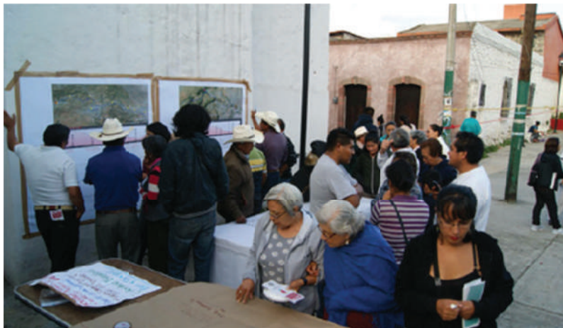
Intervención comunitaria en San Bartolomé Xicomulco, Milpa Alta 2017

De ahí que la Constitución de la Ciudad de México, al establecer derechos, acompañados por la especificación de principios constitucionales generales de los mexicanos, como el principio de progresividad en la satisfacción de los derechos sociales, ayuda a creer que el cumplimiento del derecho a la ciudad está más cerca de las ciudadanas y ciudadanos que integramos la ciudad, más aún si generamos una cultura de exigibilidad y una dirección en un proyecto de ciudad colectivo, que ya fue establecido en nuestra Constitución Política de la Ciudad de México.