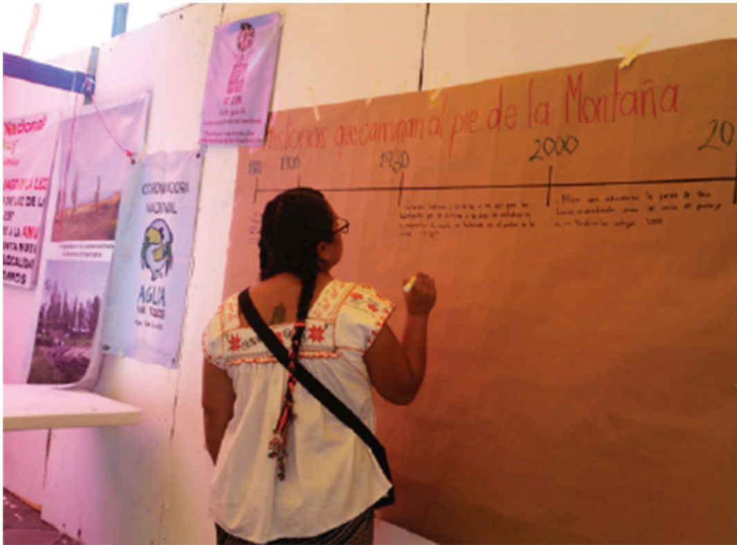
Mapeo comunitario San Lucas Xochimanca, Feria Cuatatapa 2016