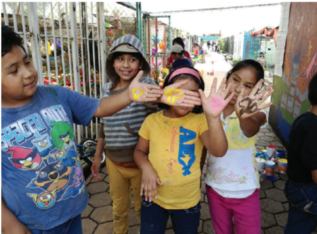
Fotografía tomada en el marco del taller de mapeos comunitarios en defensa y gestión social del territorio, en el Mercado de plantas Acuexcomac, San Luis Tlaxialtemalco, Xochimilco. Junio de 2017.

En la década de 1950, el área urbana del Distrito Federal ya comenzaba a desbordarse del territorio central para extenderse sobre los terrenos baldíos de las delegaciones de la periferia. De este modo, el crecimiento demográfico e industrial convirtió a la Ciudad de México en la principal ciudad del país y no solamente por ser la sede de los poderes federales. En los años cincuenta y sesenta, la Ciudad de México creció notablemente de norte a sur. Obras importantes como la construcción de la ciudad universitaria y el anillo periférico, la realización de conjuntos habitacionales promovidos por el Estado (como la Unidad Independencia), indican que la acción pública jugó un papel importante en ese crecimiento, para el cual se utilizaron frecuentemente terrenos de los pueblos originarios. También algunas promociones privadas siguieron a la obra pública, y entre ellas es necesario mencionar la apertura de los pedregales como zona residencial de altos ingresos. Por ejemplo, la zona del Ajusco se urbanizó en los sesenta y setenta a través de nuevos asentamientos para vivienda hacia sectores medios y populares, que comenzaron a poblar la zona poco a poco (Neira Ojuela,