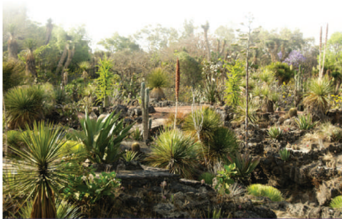
Mapa de suelo de conservación en la CDMX

Sus límites geográficos están definidos en el Programa General de Ordenamiento Ecológico del Distrito Federal, e incluyen zonas rurales donde se encuentran ejidos y se asientan comunidades.