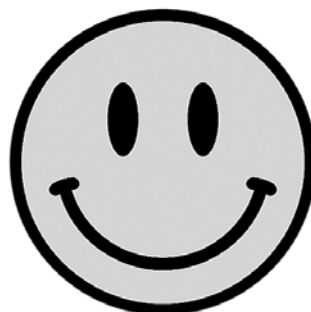
Cara feliz diseñada por Harvey Ball, 1963.

rentes aplicaciones de mensajería digital. Aunado a las imágenes descritas, hay otras de uso generalizado como la señal de peligro por radiación que, sin que se conozca el origen y significado del trébol geométrico que lo representa, es una imagen que al observarla nos pone en alerta de un peligro que puede ser mortal.