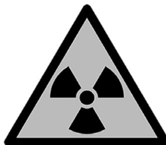
Señal de peligro de radiación.

No queda duda, como nos advierten los ejemplos descritos anteriormente, de la importancia que tienen las imágenes en la cultura humana. Si bien estas imágenes tienen un carácter universal, en lo individual estamos en constante construcción de ellas y son parte inherente de nuestro proceso cognitivo. Si cerramos los ojos por un instante y hacemos el ejercicio de recrear imágenes, seguramente alguna de estas conseguirá evocarnos olores, sabores, alegrías y miedos, entre