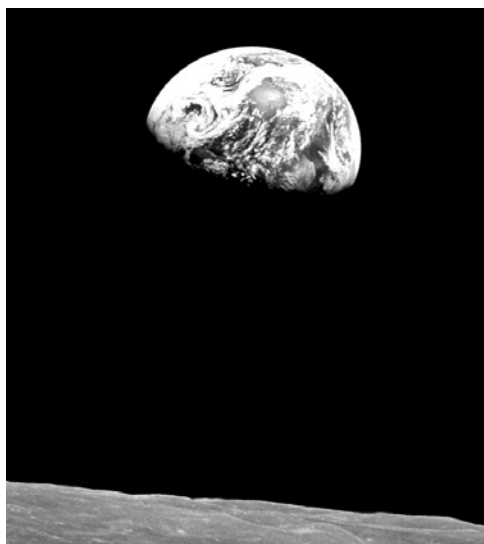
Fotografía de la Tierra enviada por la misión Apollo 8, 1968.

de la Tierra”, porque para esas fechas ya se tenían imágenes obtenidas de telescopios que mostraban claramente los discos de otros planetas, pero en nuestro caso, no podíamos tomar una fotografía de la fachada sin salir de casa. Este acontecimiento es un ejemplo de lo que una imagen puede significar, no solo para a un individuo sino para toda una sociedad.