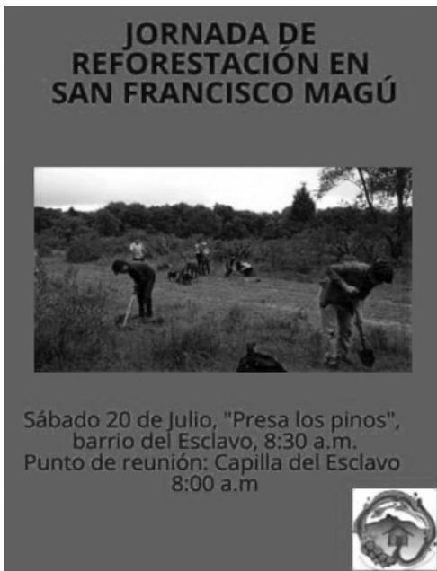
Imágenes 2 y 3. Evento de resistencia organizado por la comunidad de San Francisco Magú.

Esta construcción permite reivindicar el derecho de los conocimientos y saberes locales, valores culturales del mismo como una forma de entendimiento del mundo. Dentro de la comunidad de San Francisco Magú, la construcción de la historia ambiental fundamenta sus bases desde el asentamiento anterior al período colonial, donde el dominio nahua es parte de la identidad del lugar.