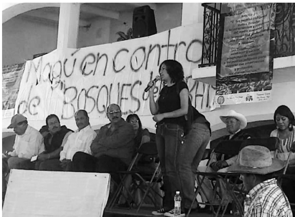
Imagen 1. Asamblea general para tomar acciones en contra del complejo inmobiliario “Bosques del Paraíso”.

Como parte de las estrategias de resistencia dentro de la comunidad se han llevado a cabo diferentes actividades comunitarias en contra de la construcción del complejo inmobiliario, para la defensa del territorio, protección del bosque y lucha por la soberanía alimenticia a partir del consumo de hongos silvestres.