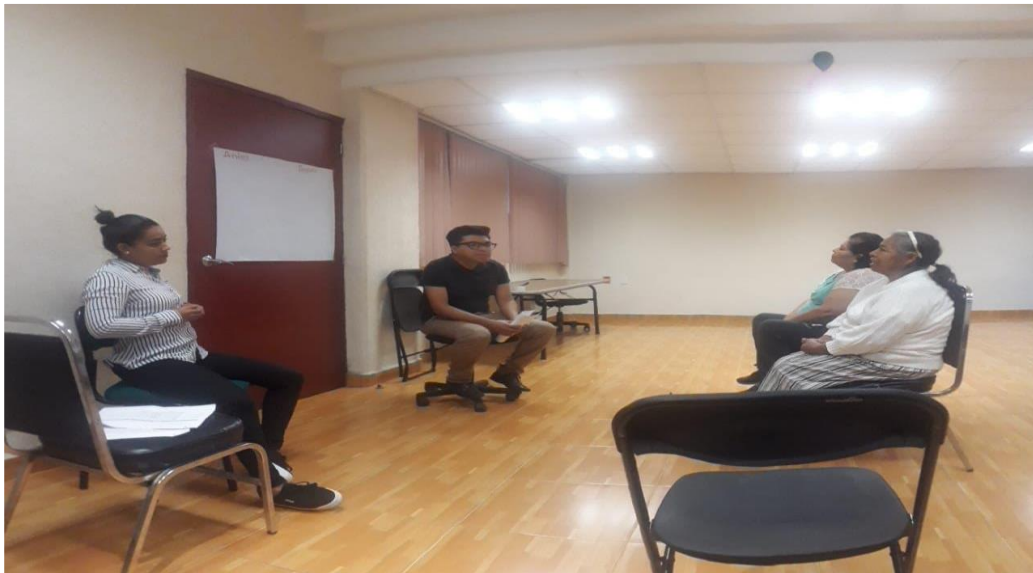
Xicotencatl, J. (2020). [PVS realizando cuadro de aprendizajes de un antes y después de realizar el curso, ideas plasmadas en papel].