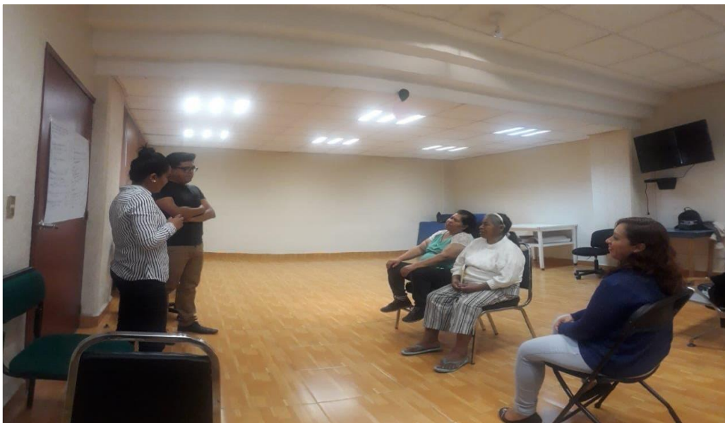
Xicotencatl, J. (2020). [Pasantes de la Lic. En Promoción de la Salud, explicando la utilidad de las respuestas obtenidas en el cuadro escrito por ellas].