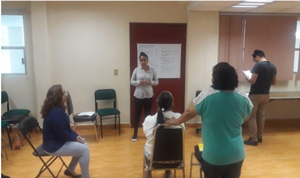
Xicotencatl, J. (2020). [Dentro del grupo reflexivo, se estaban analizando las respuestas que pusieron en cuadro comparativo de antes y después de concluir el curso].