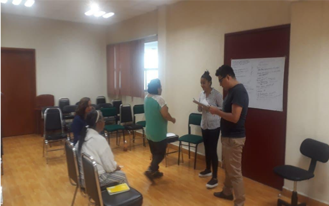
Xicotencatl, J. (2020). [Platicando con las PVS sobre su experiencia en el curso].