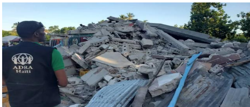
ADRA llega para evaluar los daños en Saint Louis de Sud, una zona fuertemente impactada por un terremoto reciente que afectó a Haití el 14 de agosto de 2021. [Fotografía: Evan Bernardini / ADRA en Haití]. https://noticias.adventistas.org/

El adventista converso, cuenta por lo tanto con un gran sentido de trabajo comunitario y sacrificio por su entorno; desde campañas de donación de sangre para enfermos, hasta aspectos sencillos como servicios a la comunidad como barrer o pintar banquetas, la influencia del adventista es siempre positiva dentro de su entorno, el mensaje de cambio de percepción del mundo, va acompañado con un mensaje de mejor calidad de vida para sus miembros, por lo tanto, mucho de su trabajo va a encaminado a compartir de este mensaje a través de un impacto positivo.