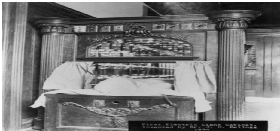
Imagen 1.3. El primer gabinete de luz eléctrica del Sanatorio de Battle Creek, inventado por el Dr. John H. Kellogg en 1894. Foto cortesía del Centro de Investigación Adventista. Retomado de https://encyclopedia.adventist.org/ [Recuperado el 13 de enero del 2023]

Notablemente más joven que los primeros líderes del adventismo, el inquieto médico logró bajo su dirección, idear una serie de implementaciones novedosas a través de las cuales supo engrandecer el llamado “ministerio de sanación” promovido por el adventismo. Una de estas innovaciones, por ejemplo, fue que ante la creación de los primeros productos que reemplazaban la carne y los famosos “copos de maíz”, tuvo la idea de empaquetar (al parecer por primera vez en la historia de la industria estadounidense), en pequeños envoltorios hechos de aluminio las diminutas barras de distintos tipos de cereales para así mantenerlos frescos e incrementar su venta; portar un nombre que funcionara como lo que ahora conocemos como “marca” también fue una de las implementaciones capitalistas comerciales aportadas por el reciente líder. Defensor inquebrantable de la reforma pro salud adventista, el Dr. Kellogg escribió además cerca de 50 libros en los que abogaba a favor de la hidroterapia, el ejercicio y la dieta vegetariana. De inventor también tuvo mucho, ingenió una máquina para dar terapia física y un negocio donde los compradores podrían pedir por medio de un catálogo productos a larga distancia. 54