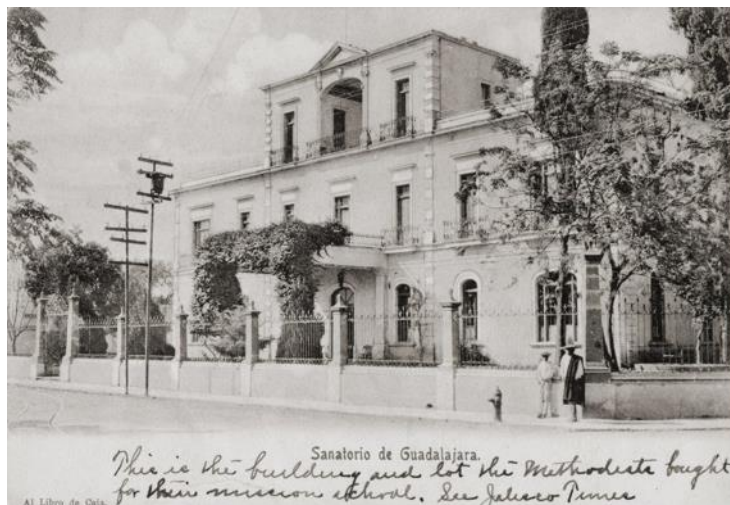
Foto del sanatorio Adventista de Guadalajara hacia el año 1900

Las problemáticas por el gran poder que estaba acumulando Kellogg respecto la obra médica adventista aunado a una disertación teológica comenzaron a provocar una ruptura que perjudicaría especialmente al sanatorio de Guadalajara ya que este, había sido una obra casi personal del afamado doctor.