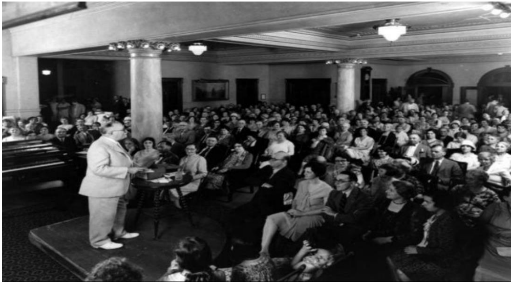
Imagen 1.2. Los invitados del Sanatorio de Battle Creek escuchan al Dr. John H. Kellogg durante sus sesiones semanales de preguntas.

John Harvey Kellogg quizá sea uno de los ejemplos en los que con más claridad podemos ver este cambio de comportamiento y percepciones propias del hombre perteneciente a la modernidad americana ya que fue un líder visionario totalmente acorde al momento histórico que le tocó vivir, es decir, un personaje moderno sí, pero también capitalista.