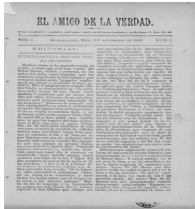
Imagen 3.1 Portada del periódico “El amigo de la verdad” publicado en Guadalajara, México, en 1896.

Respecto las publicaciones, ese mismo año, 1896, salió a la luz en México el primer periódico misionero en español de la Iglesia Adventista llamado: El amigo de la verdad. 135