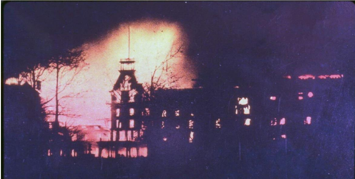
Imagen 1.6. Fotografía del sanatorio adventista de Battle Creek, Michigan, siendo consumido por las llamas el 18 de febrero de 1902.

Esta novedosa manera de entender al Dios judío como bastante interesado en asuntos profanos, va a ser una de las características del “espíritu del capitalismo” de las que nos habla Max Weber. Aquel Dios que el catolicismo, el viejo protestantismo, los valdenses primitivos, entre otras tantas denominaciones habían entendido a lo largo de los años como el Dios de los pobres, de las viudas, de los huérfanos y de la justicia, será entre estos nuevos protestantismos norteamericanos el Dios de la inversión, la compra, la venta, las patentes y los abogados.