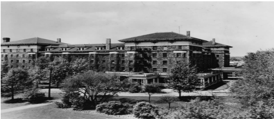
Imagen 1.4. Sanatorio de Battle Creek, edificio Fieldstone, c. 1900.

El acelerado desarrollo de esta empresa lo podemos ver por ejemplo en el creciente número de pacientes que echaban mano de sus instalaciones ya que el hospital pasó de tener veinte camas a setecientas en tan solo seis años. Pronto este modelo de implementar la medicina se exportaría a otras partes del mundo, vendiendo, promoviendo y estimulando un estilo de “vida saludable” 55