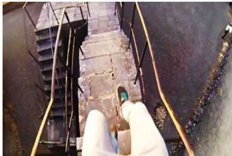
Figura 3. [Imagen parkour saltando escaleras] Recuperado de http://ell.akamai.coub.com/get/b2/p/coub/simple/cw_timeline_pic/2e152c6bc56/f556276164bc457d54b2a/med_1411088657_1390045354_image.jpg

Más ejemplos de esto lo podemos ver en el corto, realizado por un grupo de jóvenes que se dedican a producir video blogs dentro de su página en youtube llamada Enchufe TV (2013) tienen una sección llamada “Viendo cómo...” aquí el único punto de vista que se utiliza, es el subjetivo, cómo lo podemos ver en Viendo como burócrata en donde la intención del video es que se muestre cómo es que el burócrata ve su trabajo, se muestra como el burócrata, siempre pone peros para autorizar algo, siempre le importan más los juegos, etc. Dentro de este canal hay más videos de esta especie y con temas comunes en donde lo que resalta es el punto subjetivo del actor principal.