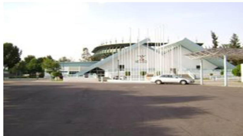
Figura 5. [Photo of Centro Paralímpico Mexicano] (2010)