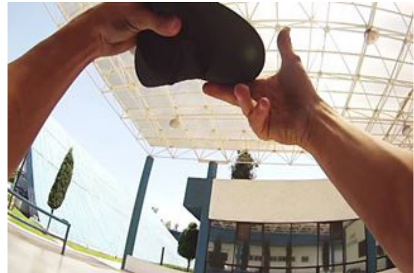
Fotografía 5. Movimiento inclusivo [fotografía]. (2014)

Con esto concluyo el apartado de definiciones, ejemplos y características sobre la toma subjetiva, elemento que ha sido parte de este documental, ya que permiten acercar el proyecto a su objetivo, que es en primer instancia cambiar la idea de discapacidad, tomando en cuenta lo que presenta Juan Antonio Ledesma (2008) en su texto La discapacidad un asalto a los medios de comunicación , en donde se debe presentar a la persona con discapacidad realizando actividades como cualquier otra persona y no resaltando su discapacidad, esto