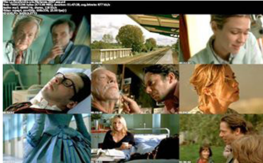
Figura 1. [Imágenes de la película “La escafandra y la mariposa”]

Como vemos la toma subjetiva, es un punto de vista que se utiliza para dar una intencionalidad determinada al video, como lo menciona Alonso Ruvalcaba en su texto Por la renovación de la cámara subjetiva (2010), donde nos da ejemplos de los distintos resultados que se pueden obtener a través de una toma subjetiva. Menciona Ruvalcaba que al usarse la cámara subjetiva podemos obtener una inmersión total, planteando que a través de ella en una situación como drogarse, con la cámara subjetiva puede transmitirse la experiencia, adrenalina, o en una escena erótica como lo menciona el autor trasmite la sensación “como si ese orgasmo fuera de veras nuestro”. (Ruvalcaba, 2010)