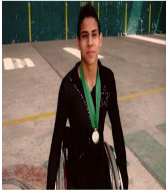
Fotografía 2. Juegos estatales-primer medalla de 2do lugar en modalidad dúo [Fotografía] (2010)

Yermain ingresó a danza deportiva, ninguno contaba con pareja, presentándose juntos sólo en exhibiciones, para más tarde a través de una prueba se decide que participen como pareja a nivel competitivo, cumpliendo así 4 años de ser pareja.