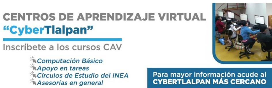
Imagen 4: Oferta de cursos.

En la alcaldía Tlalpan no se le dio continuidad a las “Ciberescuelas”, porque se incorporó el programa en 2019 a la estrategia integral de PILARES a nivel capitalino, donde son similares a las de 2017, en objetivos, estructura operativa y funciones.