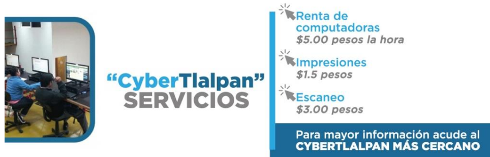
Imagen 3: Costo renta del equipo de cómputo.