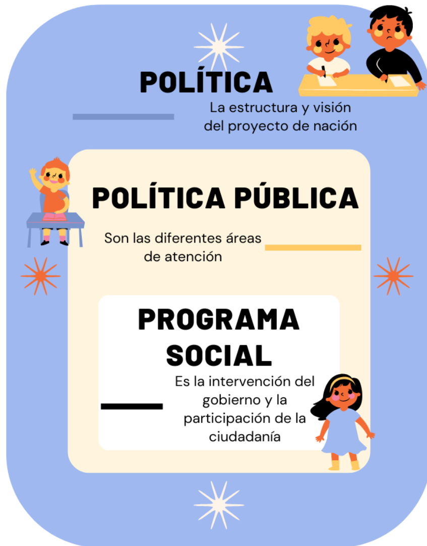
Imagen 1: Jerarquía de la política.

Política, política pública y programa social son ejes articuladores de la investigación, ya que política es el concepto que permite integrar el contexto social al identificar la visión del proyecto de nación de la política. Por ejemplo, en esta investigación se da cuenta de la convivencia de dos tipos de proyectos: por un lado, la política neoliberal, siendo la estructura de gobierno con énfasis en lo económico; por la otra parte, la política de bienestar, siendo la estructura de gobierno con énfasis en lo social.