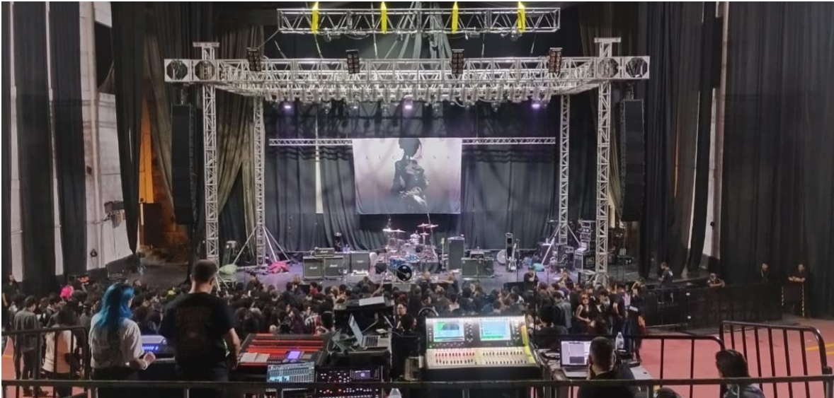
(19 de abril del 2024) Escenario de Circo Volador en el concierto de Alesana .