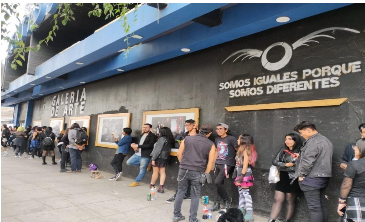
Elaboración propia. (19 de abril del 2024). Fila para ingresar al concierto de Alesana .