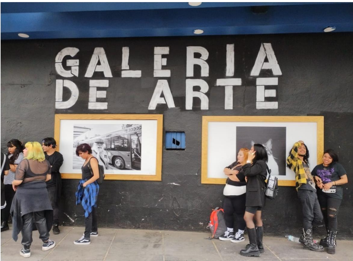
Elaboración propia. (19 de abril del 2024) Galería de arte sobre Calzada de la vida en Circo Volador .