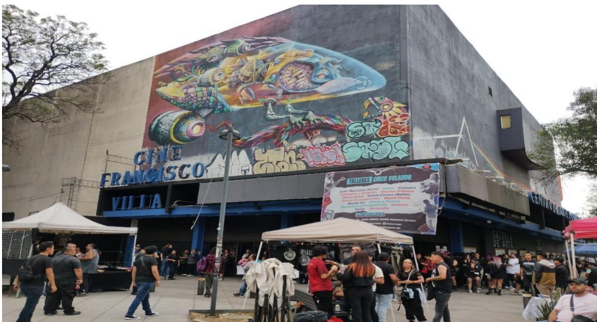
Elaboración propia. (19 de abril del 2024). Entrada principal de Circo Volador .