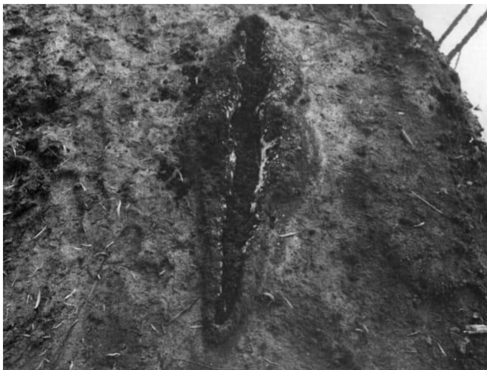
Mendieta, Ana. (1980). UNTITLED. Oaxaca, México.