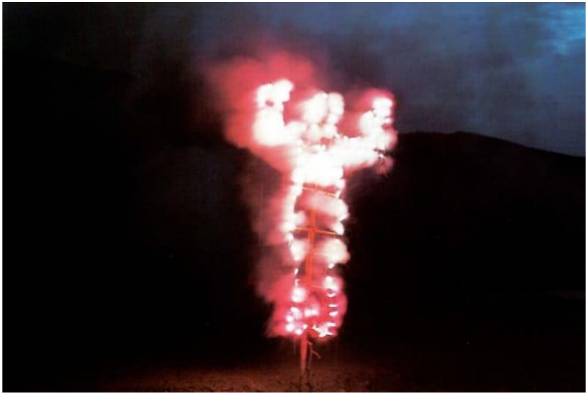
Mendieta, Ana. (1976). ANIMA (ALMA/SOUL). Oaxaca, México.