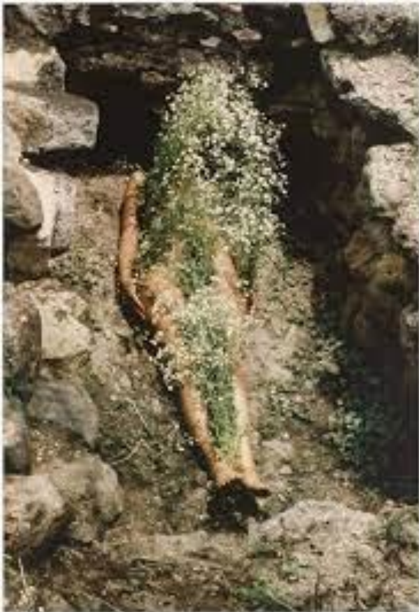
Imagen 4. Mendieta, Ana. (1973). Flowers on Body/Yagul .