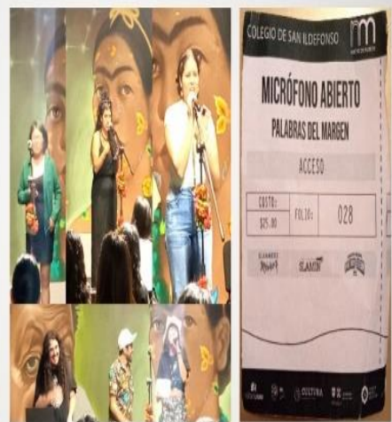
ILUSTRACIÓN 9. IMAGEN SUPERIOR: MUJERES PARTICIPANTES EN PALABRAS AL MARGEN EN COLEGIO DE SAN ILDEFONSO (24-04-24) IMAGEN INFERIOR: DJ PAOLO GUERRERO, CANUTO, DALLA.