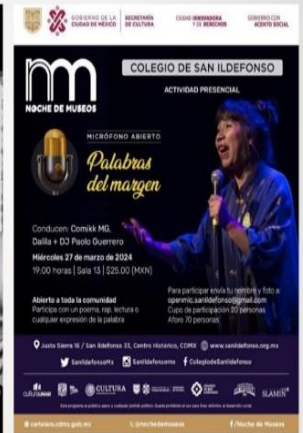
ILUSTRACIÓN 4. CARTEL DE PALABRAS AL MARGEN EN COLEGIO DE SAN ILDEFONSO (27-03-24). EN LA IMAGEN VICTORIA EQUIHUA POETA DE SLAM, MICHOACANA, FEMINISTA, CON RECONOCIMIENTO NACIONAL E INTERNACIONAL, POR SU POESÍA ESCRITA Y HABLADA.