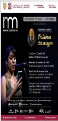
ILUSTRACIÓN 5. CARTEL DE PALABRAS AL MARGEN EN COLEGIO DE SAN ILDEFONSO (31-1-24) DISPONIBLE EN: IG CIRCUITO NACIONAL POETRY SLAM MEXICO. HTTPS://WWW.INSTAGRAM.COM/POETRYSLAMMEXICO?IGSH=MWPJNwMYTtMBHFU0A==