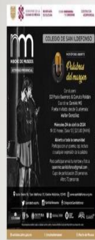
ILUSTRACIÓN 8. CARTEL DE PALABRAS AL MARGEN EN COLEGIO DE SAN ILDEFONSO (24-04-24)