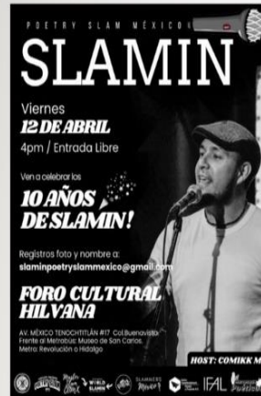
ILUSTRACIÓN 3. CARTEL DE EVENTO SLAMIN EN FORO CULTURAL HILVANA EN IMAGEN. COMIKK MG, PRINCIPAL PROMOTOR Y GESTOR DEL POETRY SLAM MEXICO. DISPONIBLE EN: IG CIRCUITO NACIONAL POETRY SLAM MEXICO. HTTPS://WWW.INSTAGRAM.COM/POETRYSLAMMEXICO?IGSH=MWPJNwMYTtMBHFU0A==