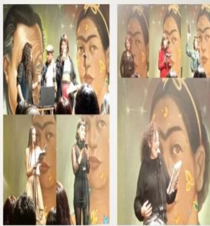
ILUSTRACIÓN 7. MUJERES PARTICIPANTES EN PALABRAS AL MARGEN. COLEGIO DE SAN ILDEFONSO (31-1-24).