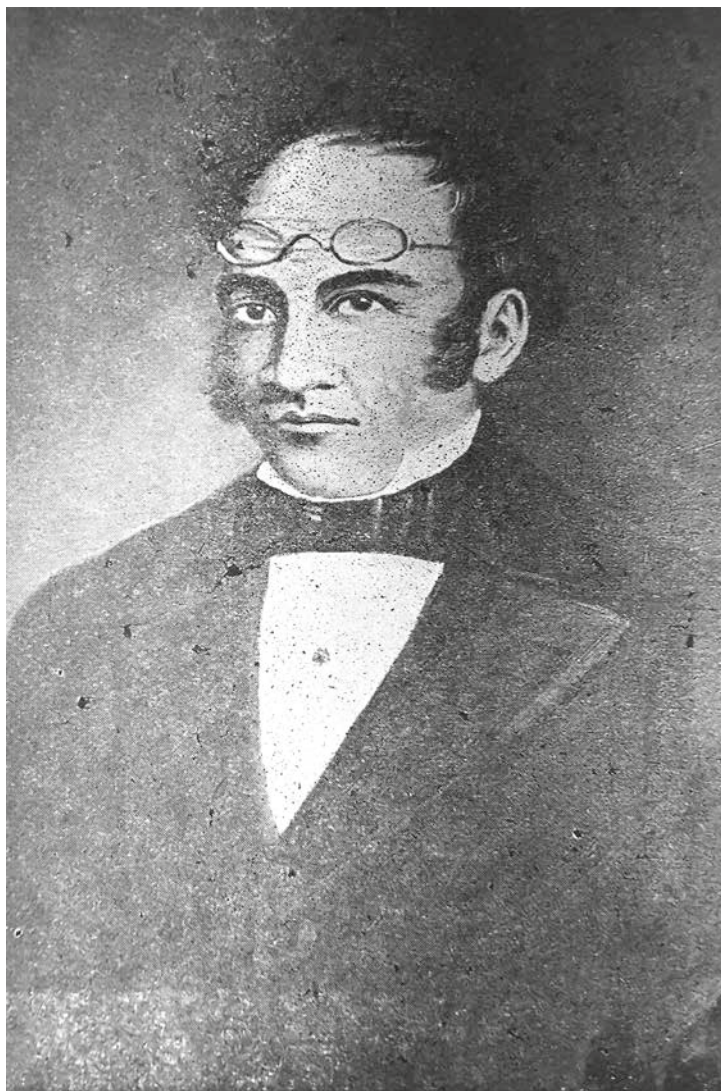
Eduardo Vascónez, Retrato de Simón Rodríguez , 14.