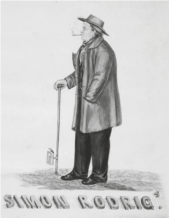
Juan Agustín Guerrero, Don Simón Rodríguez , ca. 1851.