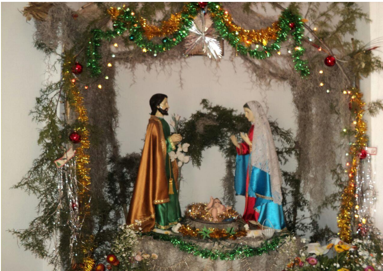
Santo que veneran los habitantes de la comunidad de Ignacio Allende cada 25 de diciembre.