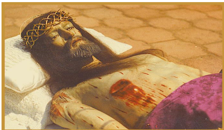
Señor de la Cueva 46

Al tratar de mover la imagen, se percataron de que había adquirido un peso mayor y no podían moverla. En ese momento los peregrinos dieron por terminada la peregrinación dejándola en aquella cueva, pues interpretaron que la imagen había decidido permanecer en Iztapalapa adoptándola como su nuevo hogar.