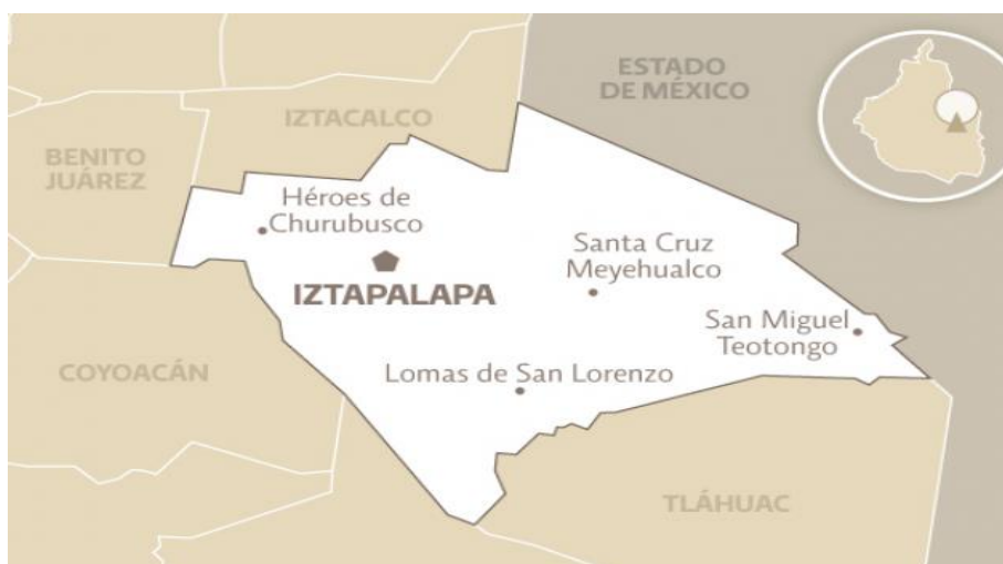
Mapa de Iztapalapa 23

En la siguiente delimitación geográfica podemos ver la ubicación exacta de Iztapalapa y las rutas de acceso a esta zona. Iztapalapa es una de las 16 delegaciones de la Ciudad de México. Tiene una extensión aproximada de 117 kilómetros cuadrados, que representan el 7.5% del área total de la ciudad de México y cuenta con 1, 815, 786 habitantes. Se ubica al oriente de la Ciudad de México, a una altitud de 2, 240 MSNM (Por sus siglas: metros