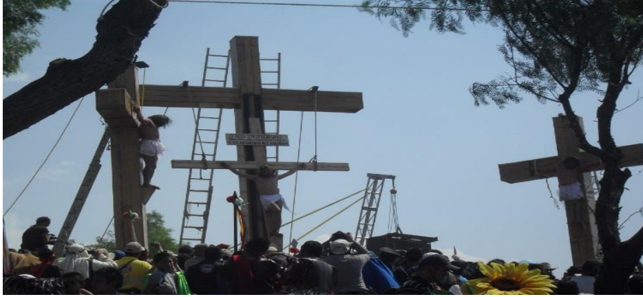
Culminación de la Crucifixión 56

Jesús: –¡Padre mío, perdónalos porque no saben lo que hacen! –en su dolor y mirando al cielo reclama. Mira a su madre para decirle: –Mujer, ahí tienes a tu hijo –voltea a ver a su discípulo y también le dice: –Ahí tienes a tu madre.