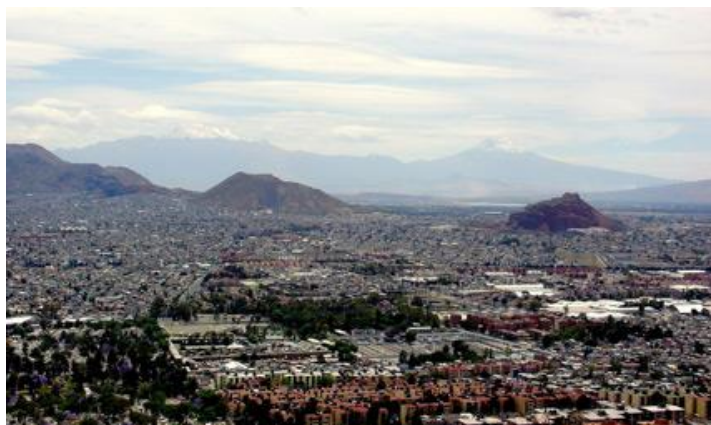
Panorama de la Delegación Iztapalapa 24

Iztapalapa comenzó con las transformaciones de su entorno, es decir, la urbanización de las vialidades, las construcciones de viviendas y de avenidas principales, haciendo que su arquitectura fuera mejorando, dándole una vista moderna a la zona oriente.