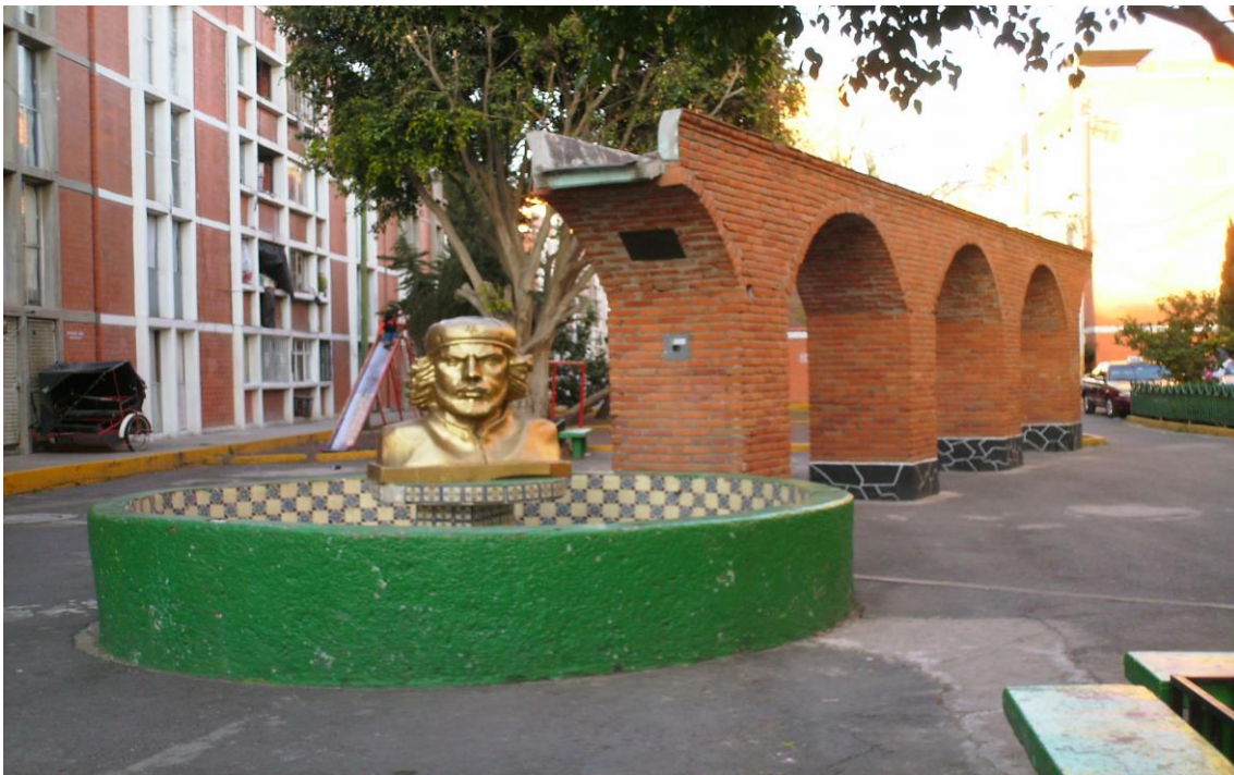
Plaza Principal "Che Guevara" de la Unidad Habitacional Francisco Villa y Manzana 25 en el predio "EL Molino"