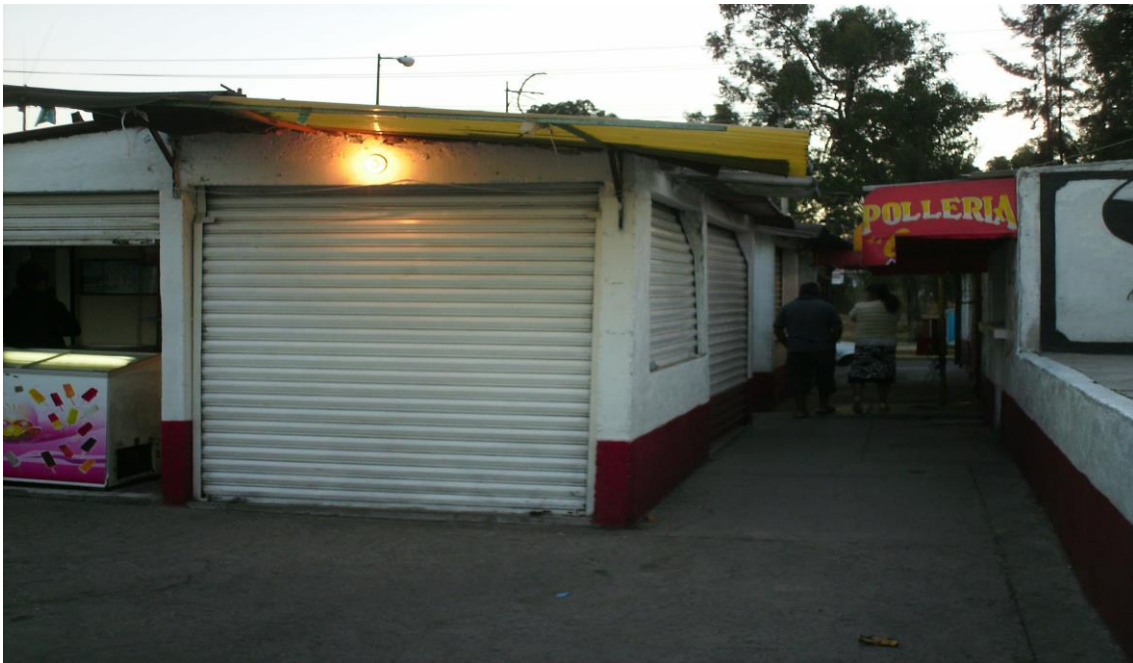
Características de locales comerciales de la “Plaza Lucha y Libertad” del campamento de MZ-24