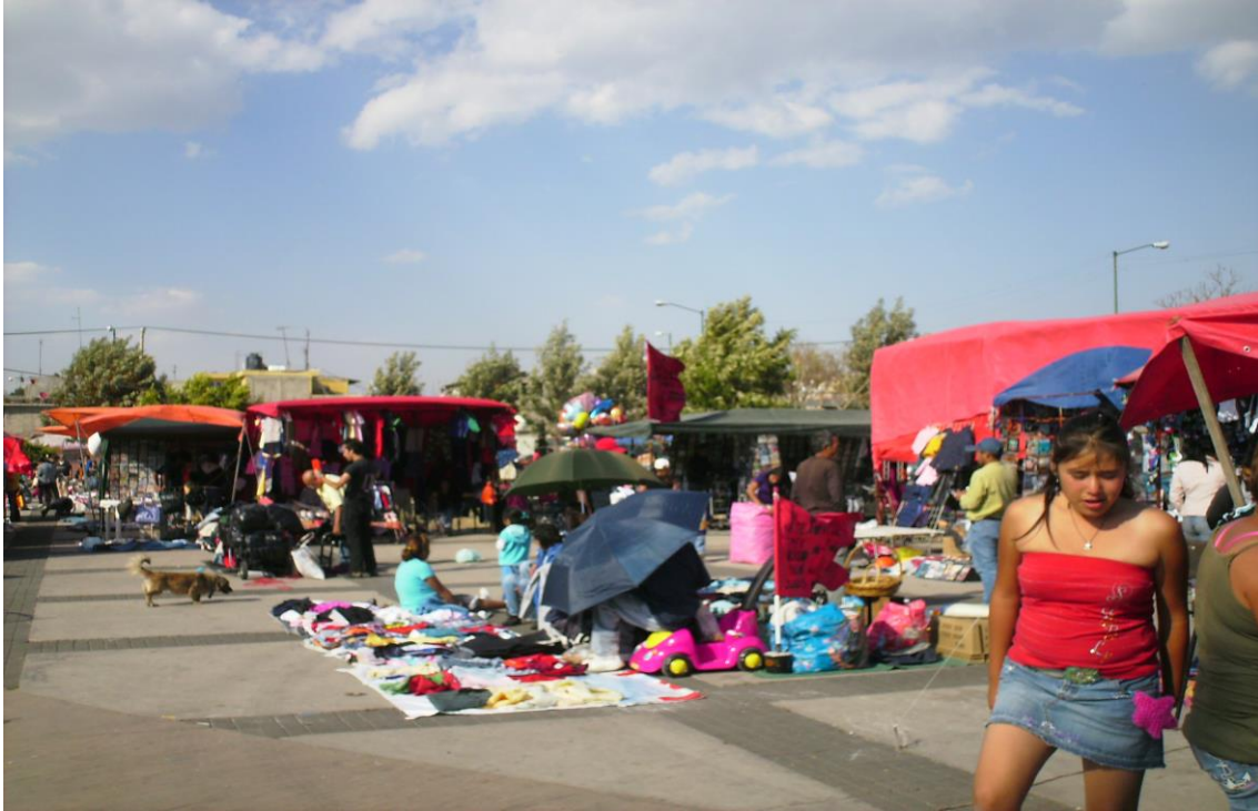
Tianguistas sabatinos y dominicales en la explanada del Mercado de Cananea