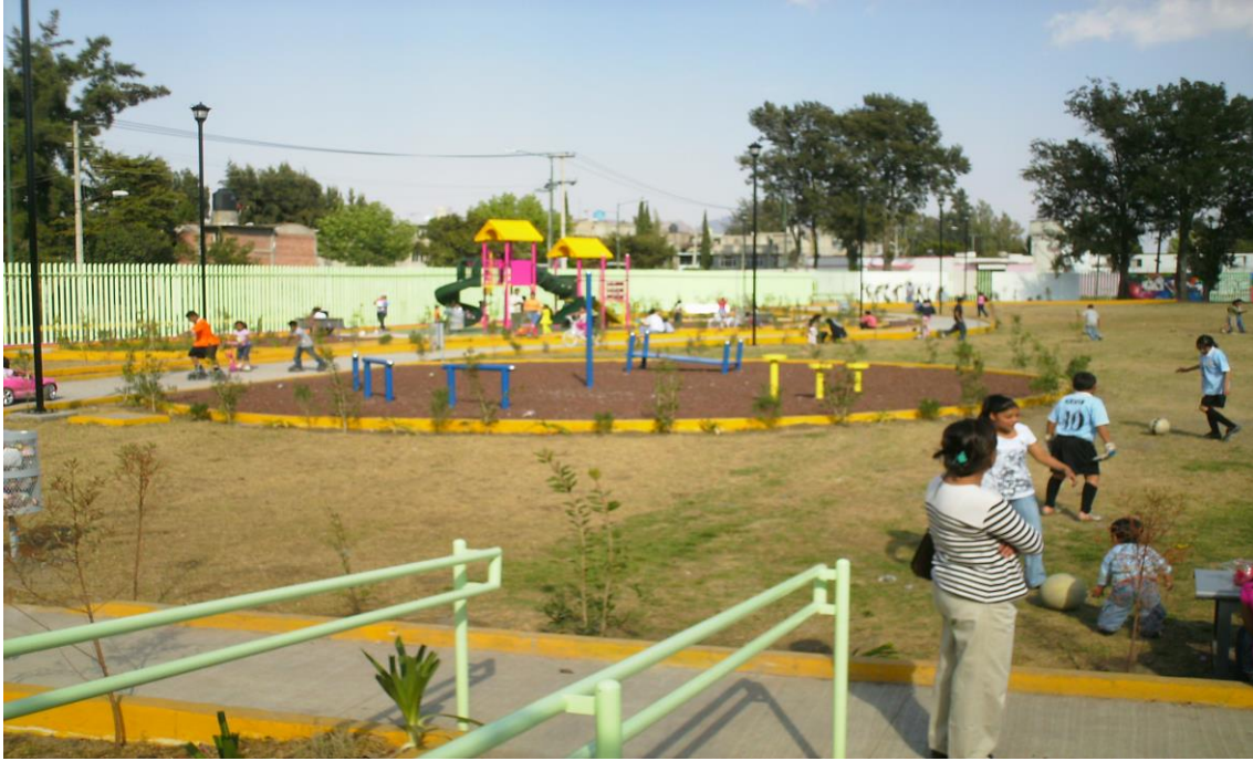
Fotografía del mejoramiento barrial: construcción de la primera etapa de un centro cultural y deportivo que ubicará en el predio denominado “Cinturón Verde el Molino”