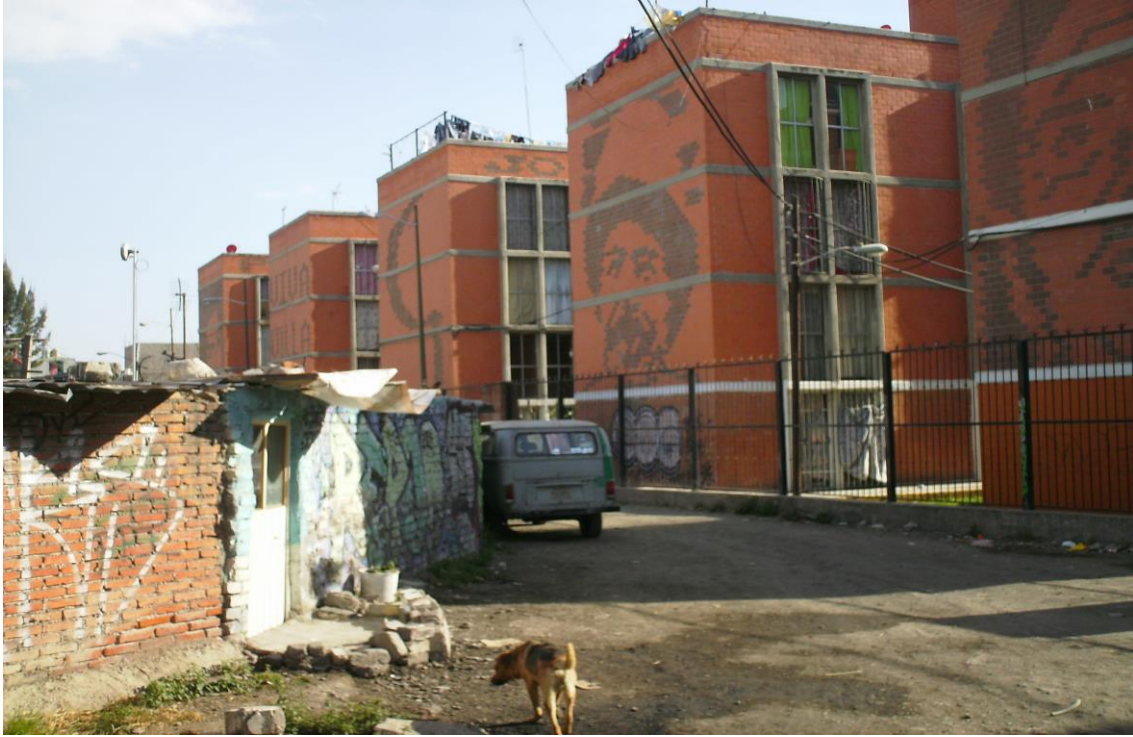
Características de las construcciones de Unidades Habitacionales de la Gestión del FPFV