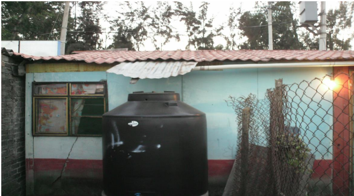
Proyecto: cosecha de agua de lluvia implementado en los campamentos del Frente Popular Francisco Villa.