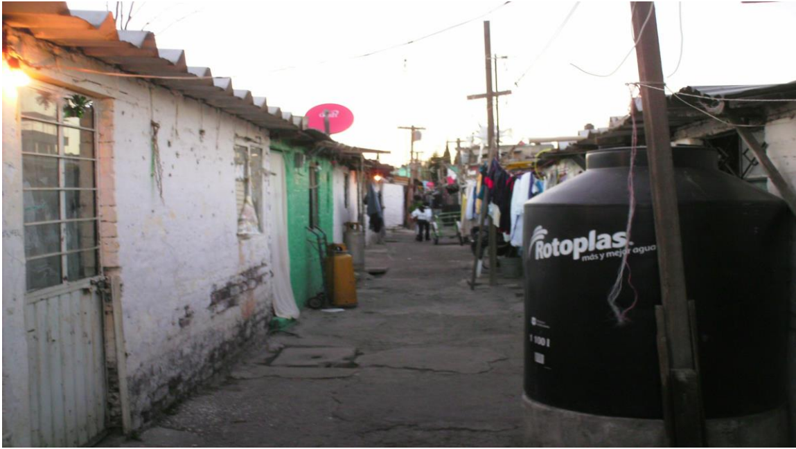
Características de los módulos existentes en los campamentos bajo la gestión del Frente Popular Francisco Villa.